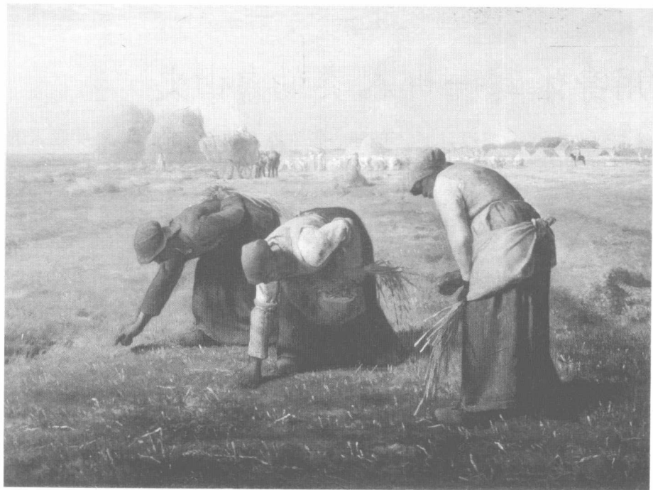
米勒的《拾穗者》，在农耕文明时代，身体的特点是面朝黄土背朝天。