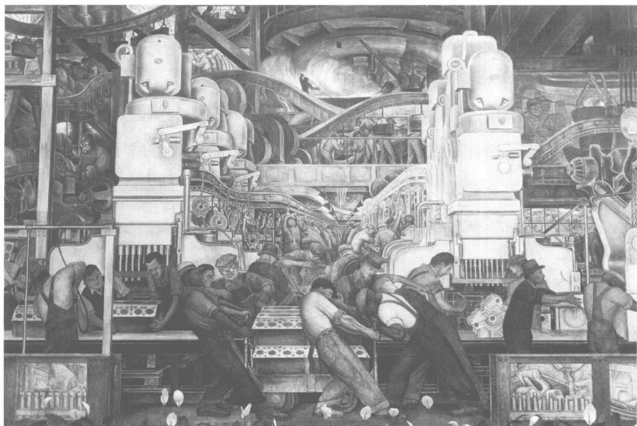
迭戈·里维拉的《底特律工厂》，在工厂里，身体成为机器的部件。