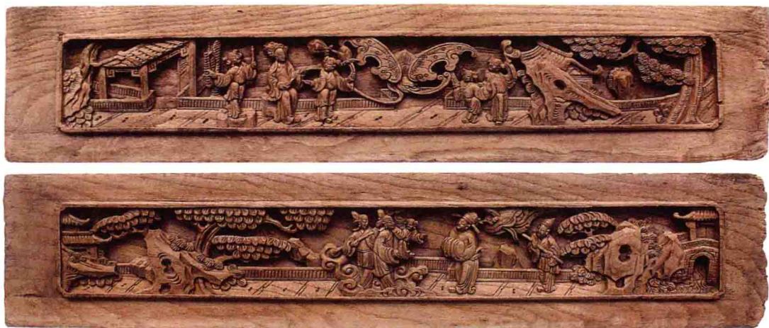
图1-1-1 人物故事雕花板一对(清)江西