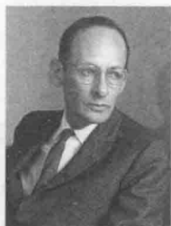
(Philip A. Fisher, 1907 - 2004)

成长股价值投资策略之父 现代投资理论的开路先锋 近半世纪以来最杰出的投资顾问 华尔街极受尊重和推崇的投资专家