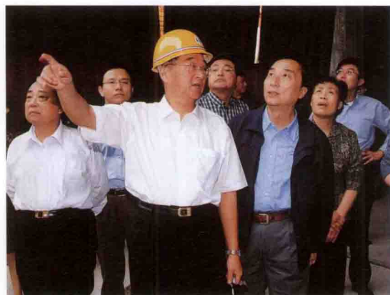
全国政协副主席胡启立(中)考察三峡工程