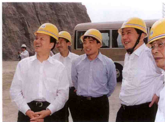
华能国际电力股份有限公司董事长李小鹏(右二)在三峡工地