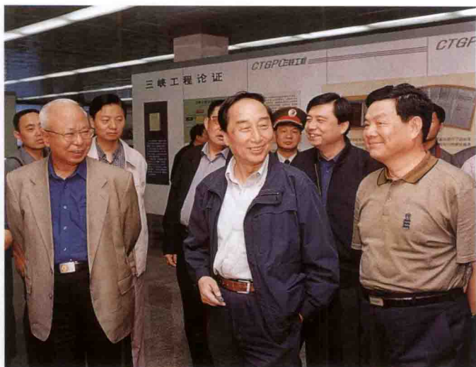
解放军副总参 谋长隗福临上将 (左一)参观三峡工 程展览