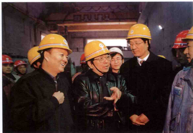
中共中央书记处书记、组织部部长曹庆红(中)考察三峡工程