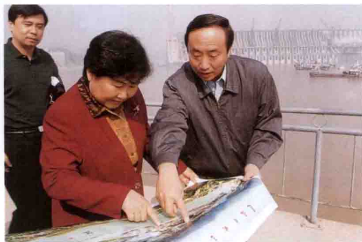
国土资源部副部长寿嘉华 (女) 参观三峡工程