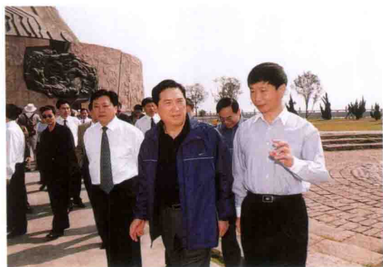
中国建设银行行长张恩照(前排右二)在三峡工地