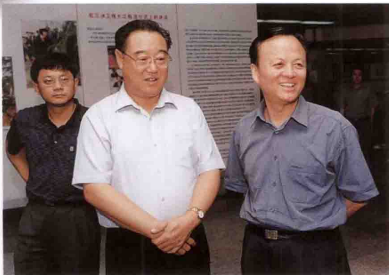
中央企业工委副书记王瑞祥 (中) 参观三峡工程展览