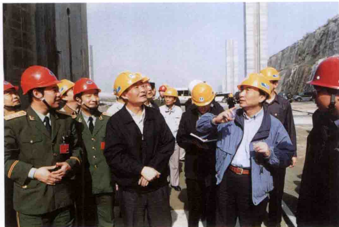
国务院副总理吴邦国视察三峡工程