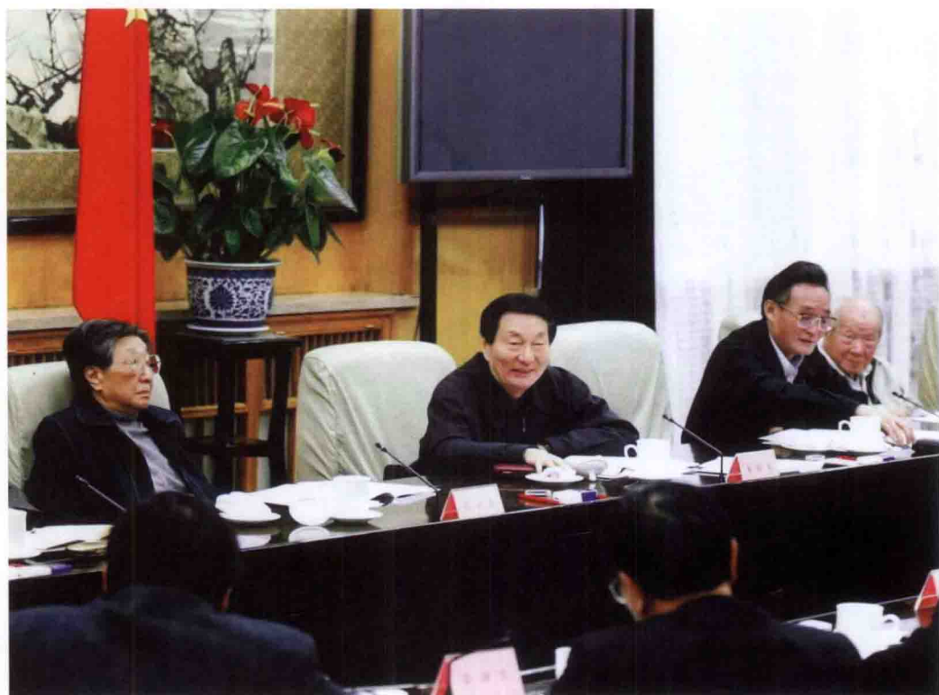
朱镕基总理在国务院三峡工程建设委员会第十一次全体会议上作重要讲话