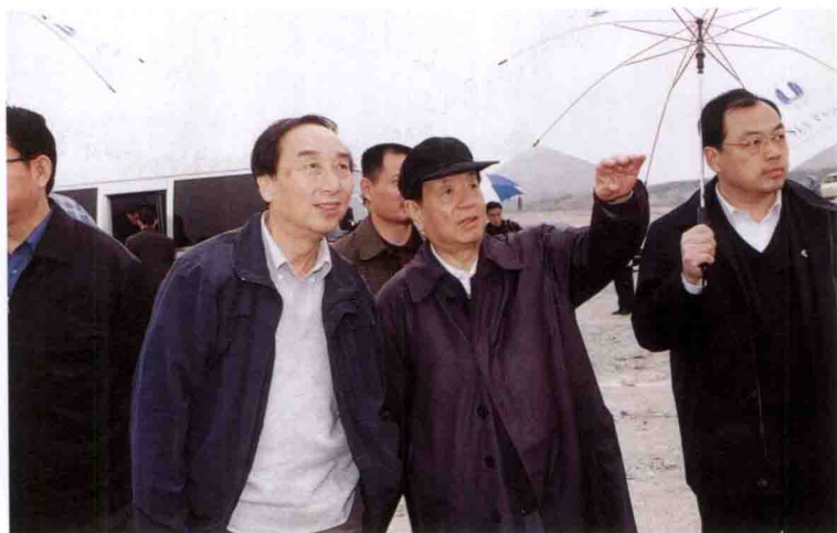
国务院副总理钱其琛视察三峡工程