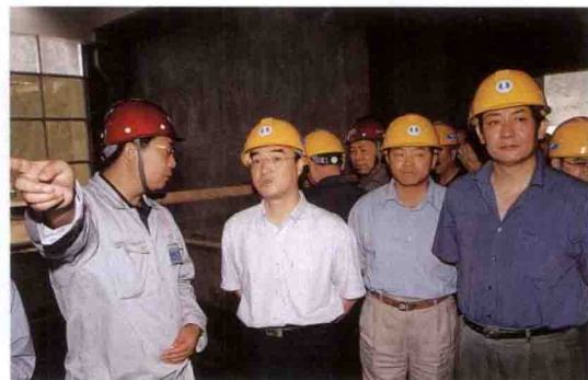
交通部副部长翁孟勇(左二)在三峡工地