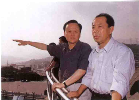
国务院体改办副主任郎秉仁(右一)参观三峡工程