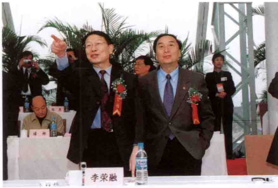
国家经贸委主任李荣融出席三峡导流明渠截流仪式