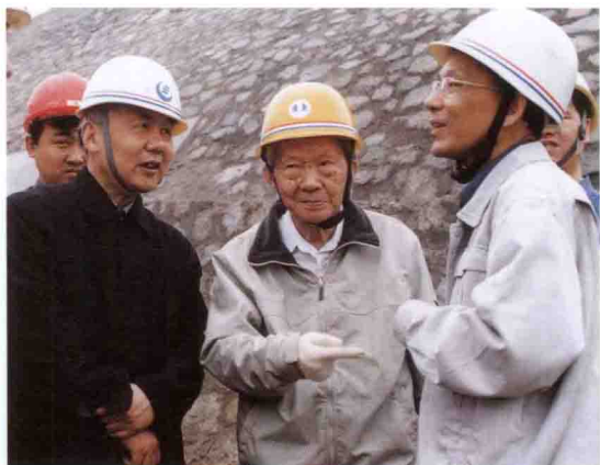
著名水电专家张光斗(中)在三峡工地