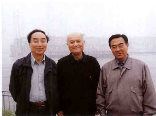
原中组部常务副部长李锐(中)在三峡工地留影