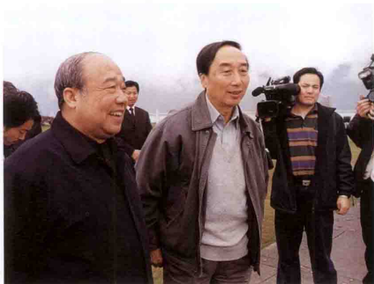
外经贸部部长石广生(左一)考察三峡工程