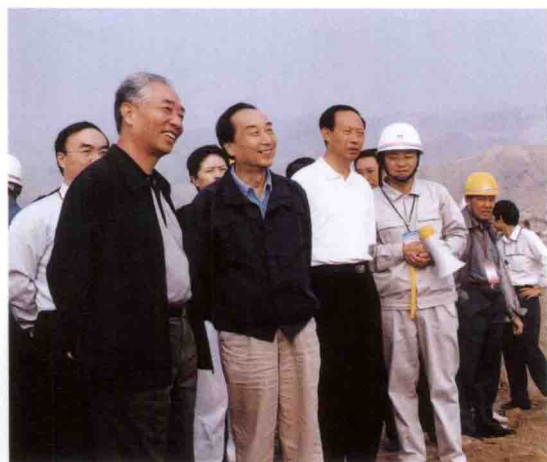
水利部部长汪恕诚(左一)考察三峡工程