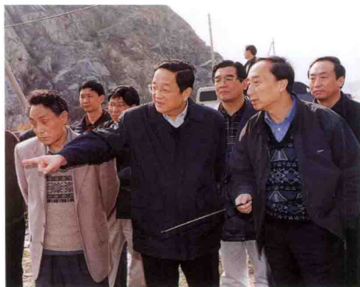
湖北省委书记俞正声(中)考察三峡工程