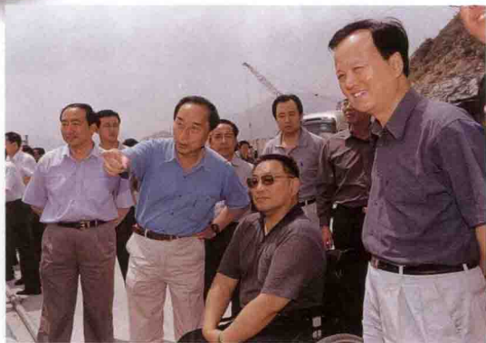
全国残联主席邓朴方(右二)参观三峡工地