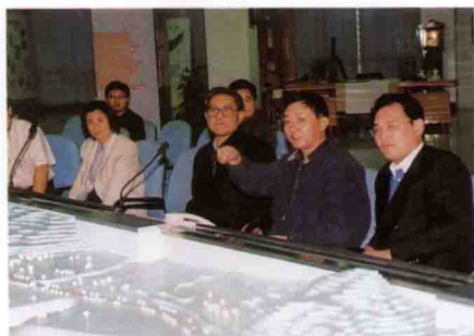
香港华润集团董事长陈新华(右三)参观三峡工程展览