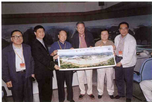
全国政协常委,中央统战部副部长张廷翰(左三)参观三峡工程展览