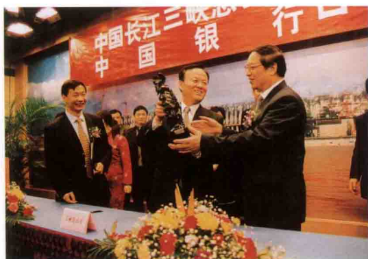
中国银行行长刘明康(右一)参观三峡工程