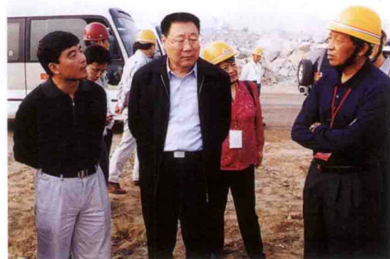
水利部副部长张基尧(中)在三峡工地