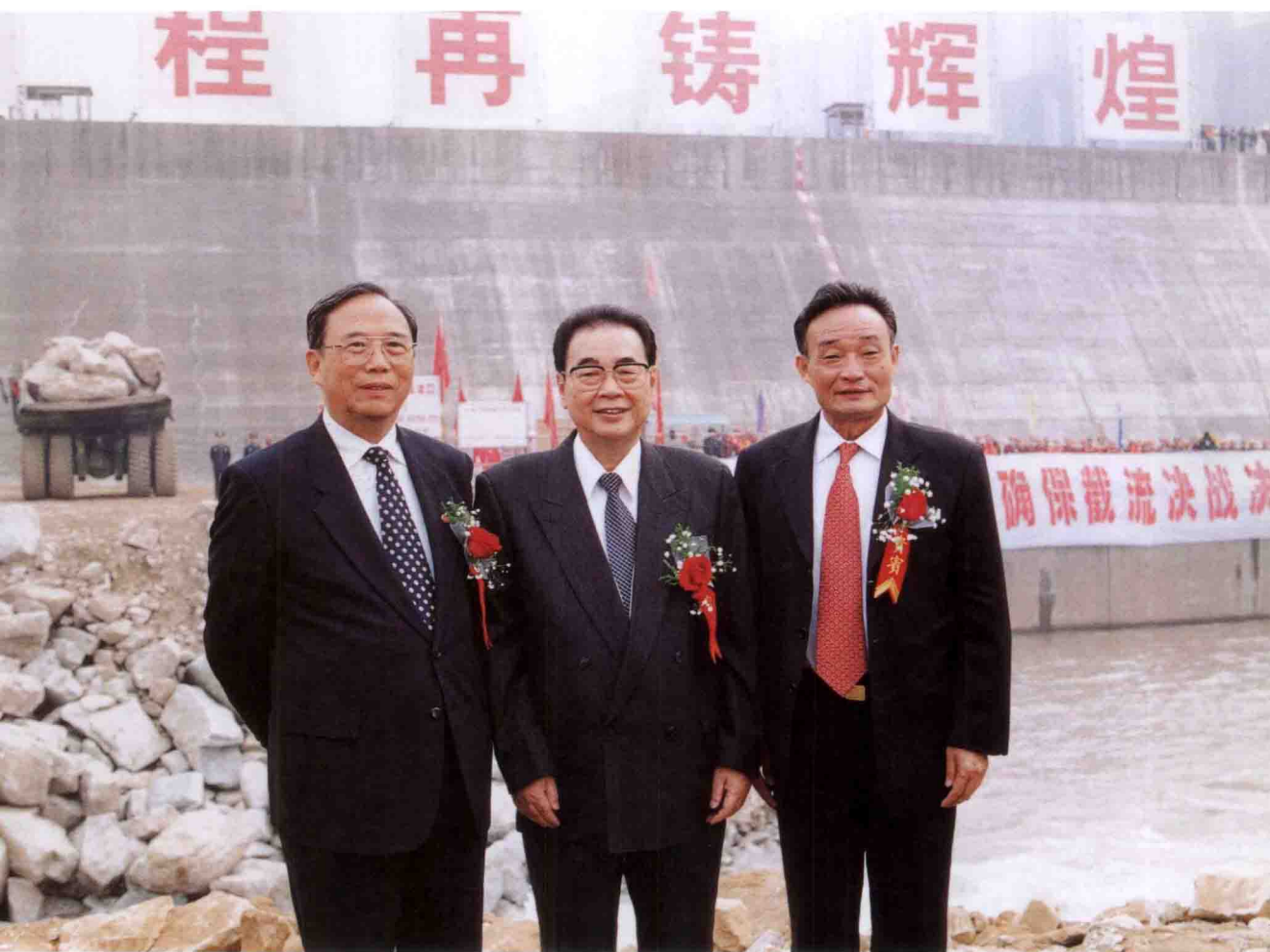
全国人大委员长李鹏、国务院副总理吴邦国、国家计委主任曾培炎出席三峡导流渠截流仪式