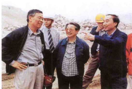
全国政协副主席钱正英(中)考察三峡工程