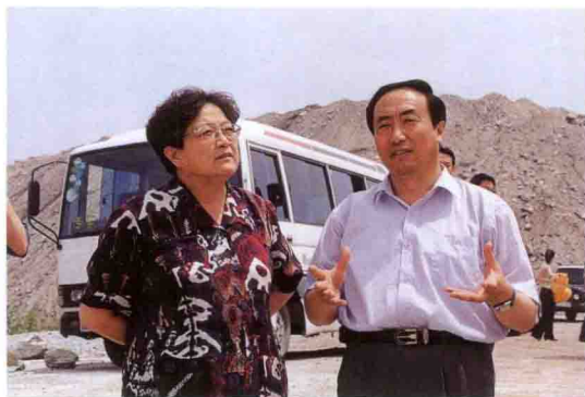
国家劳动和社会保障部副部长王建伦(女)参观三峡工程