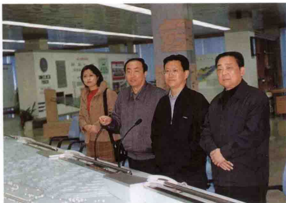
西藏自治区副主席杨松(右二)参观三峡工程展览