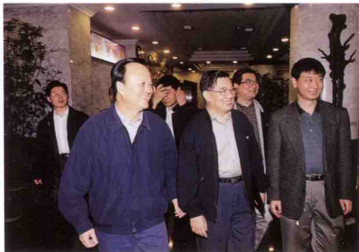
国家审计署审计长李金华(中)考察三峡工程