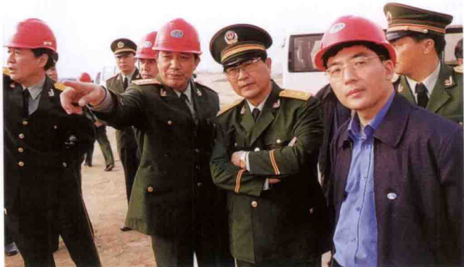
武警总部司令员吴双战中将(前排右二)在三峡工地