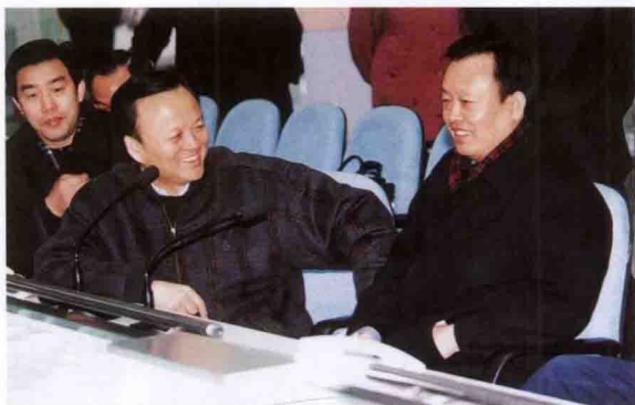
宁夏自治区党委书记陈建国 (右一) 参观三峡工程展览