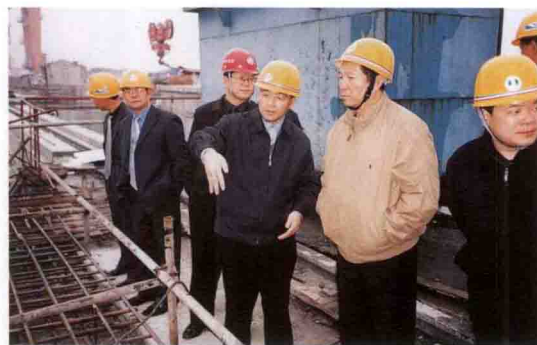
云南省常务副省长牛绍尧(右二)参观三峡工程