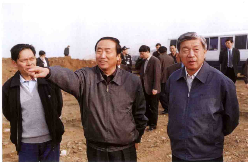
公安部副部长田期玉 (右一)参观三峡工程