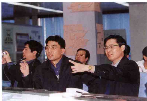
广西壮族自治区党委副书记 刘奇葆(右一) 参观三峡工程