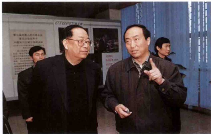
中纪委副书记傅杰(左一) 参观三峡工程展览