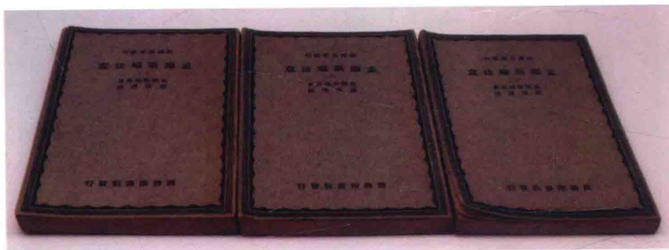
1931年出版的《法意》書影