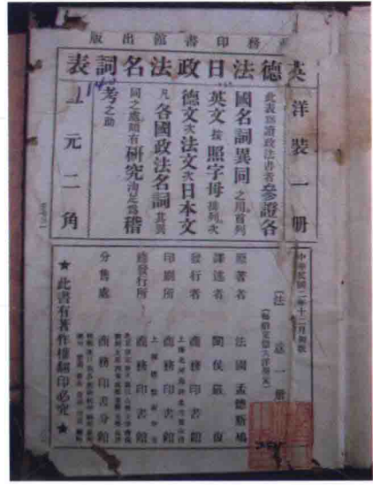
1913年版《法意》書影——版權頁