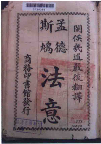
1913年版《法意》書影——扉頁