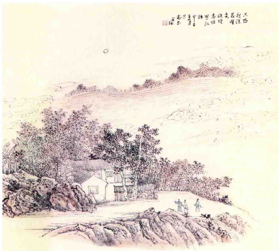
只恐夜深花睡去 故烧高烛照红妆