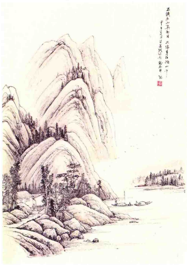
不识庐山真面目 只缘身在此山中 尺寸：68cm×45cm