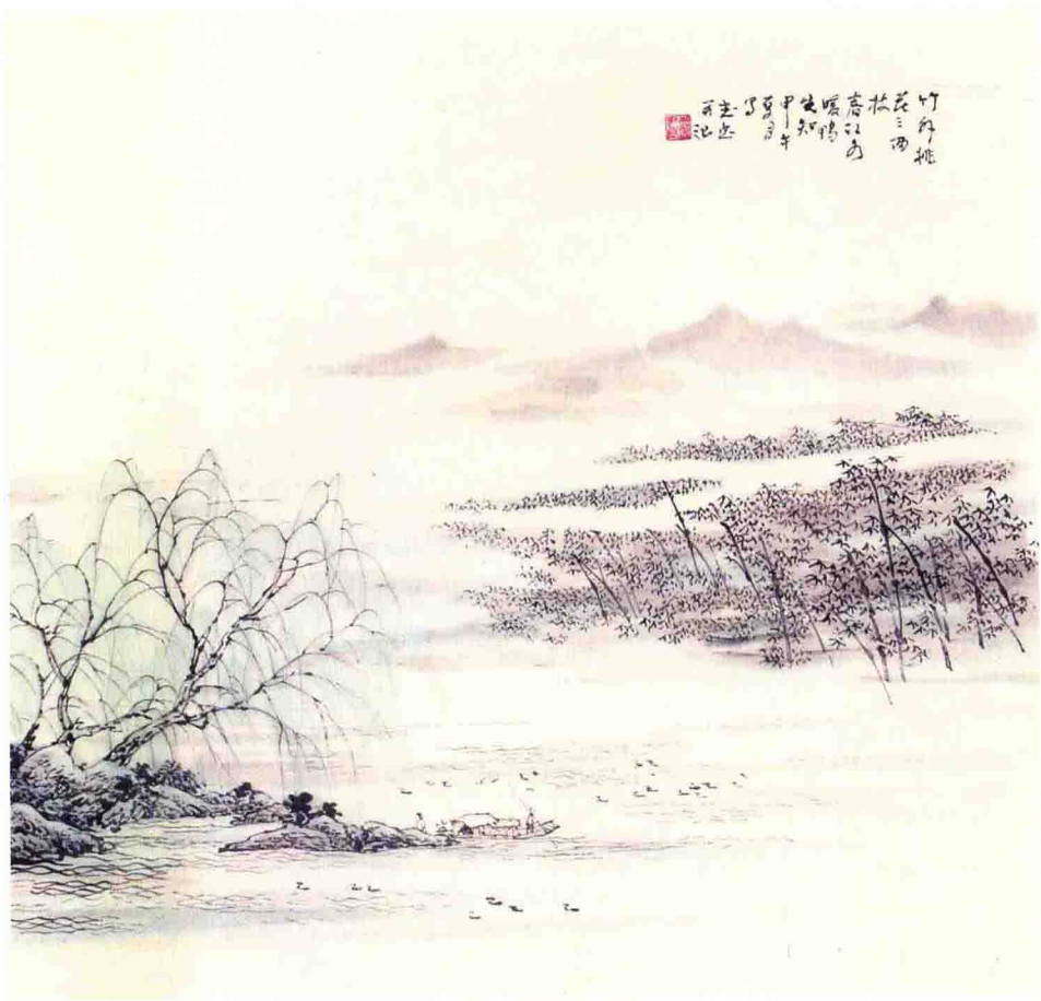
竹外桃花三两枝 春江水暖鸭先知