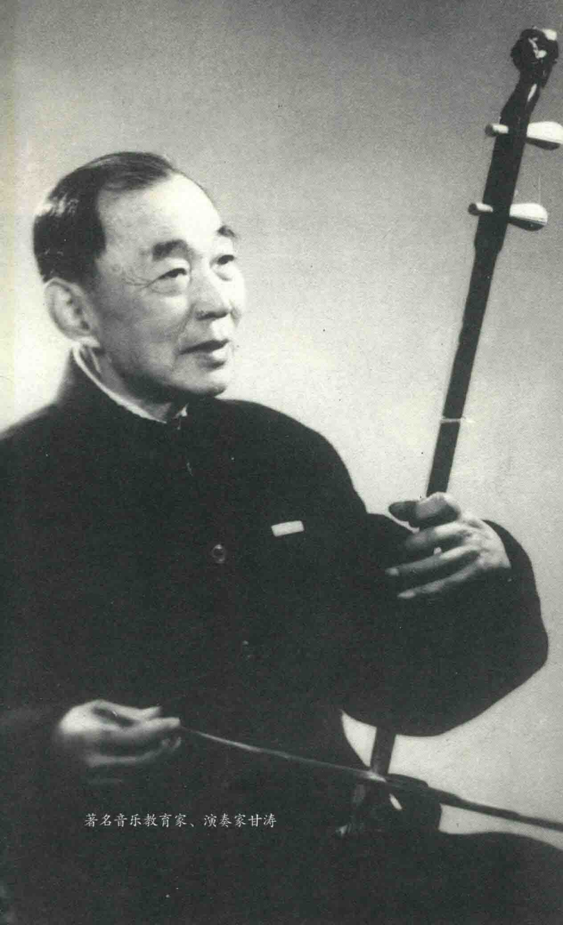
著名音乐教育家、演奏家甘涛