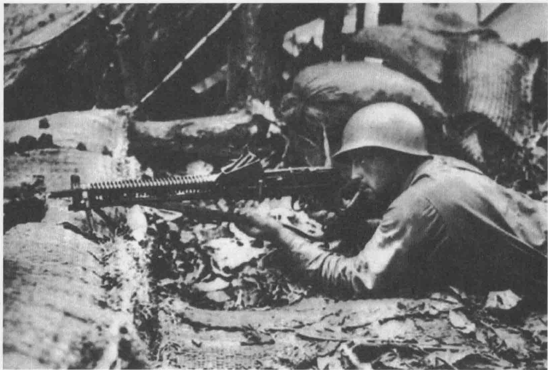
▲ 陆战1师登陆瓜岛，瓜岛战役的胜利使美军彻底夺回了战争主动权

场。理由是参谋长联席会议在1943年的作战目标是攻克拉包尔，突破所罗门——新几内亚组成的俾斯麦屏障，跃进到广阔的中部太平洋。