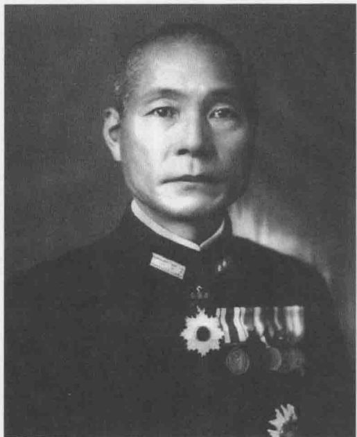
▲ 时任第8舰队司令长官的三川军一中将，萨沃海战的全胜让他扬名天下

11月22日02点00分，“卷波”号和“羽风”号护卫着“千早丸”号、“神威丸”号和“宝运丸”号组成蒙达第二次运输队，搭载着第22设营队和设营器材从肖特兰出航。清早由于布因基地的天气状况不佳，第8舰队司令长官三川军一中将召回了运输队，并下令增