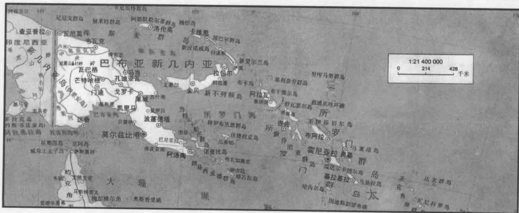
▲ 岛屿星罗棋布的所罗门群岛和南太平洋

1942年12月，英美联合参谋长会议开始讨论和准备起草下一年度总体作战计划。美国总统罗斯福和美国参联会也准备前往法属摩洛哥的卡萨布兰卡，和英国首相以及英国