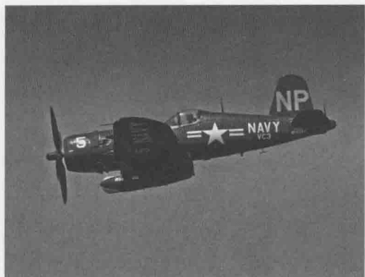
▲ 瓜岛战役中大显身手的“仙人掌”航空军，他们是日军的头号劲敌