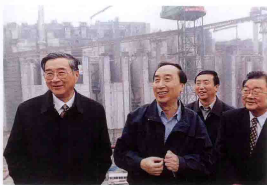
全国政协副主席胡启立(左一)考察三峡工程