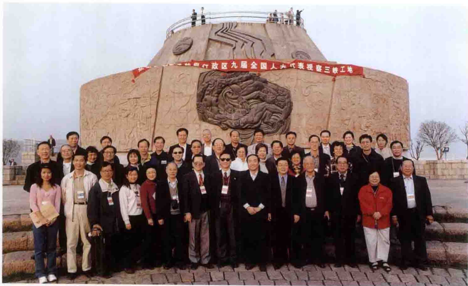
香港九届人大代表考察三峡工地