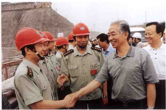
水利部部长汪恕诚(右二)考察三峡工程