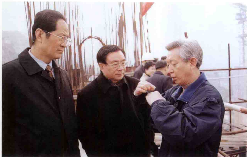
重庆市委书记贺国强（中）考察三峡工程