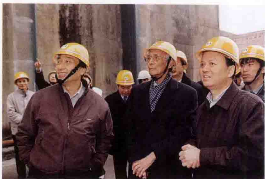
全国政协副主席、中国民生银行董事长经叔平(左二)参观三峡工地