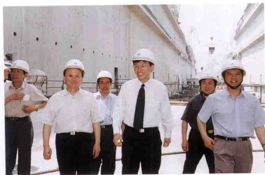
国家科技部副部长李学勇（右三）考察三峡工程