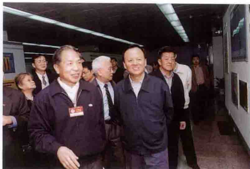
全国政协委员、甘肃省政协主席杨振杰（左）参观三峡工程