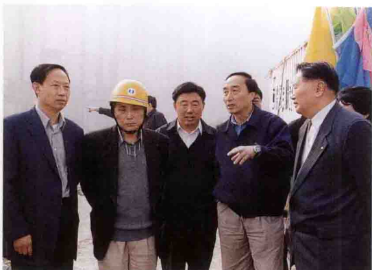
国土资源部部长田凤山（中）考察三峡工程