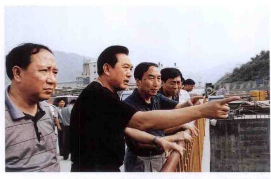
中央台办、国务院台办主任陈云林(左二)考察三峡工程