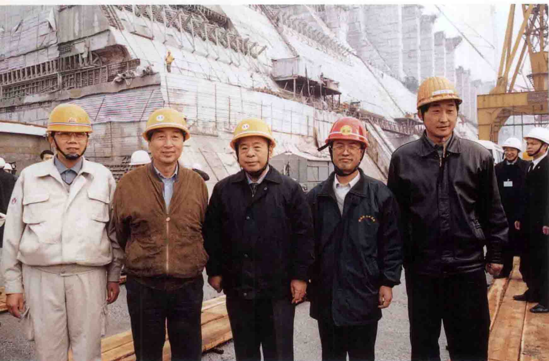
中共中央政治局常委、中纪委书记尉建行视察三峡工程