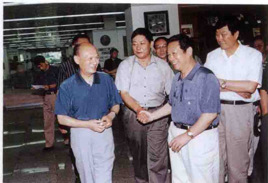
全国人大教科文卫主任委员朱开轩（左一）参观三峡工程展览馆