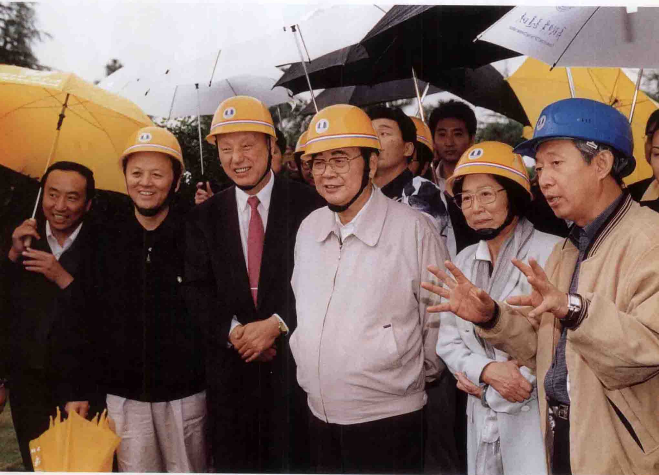
中共中央政治局常委、全国人大委员长李鹏及夫人朱琳视察三峡工程