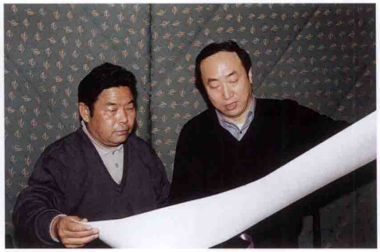
西藏自治区副主席加保(左)考察三峡工程