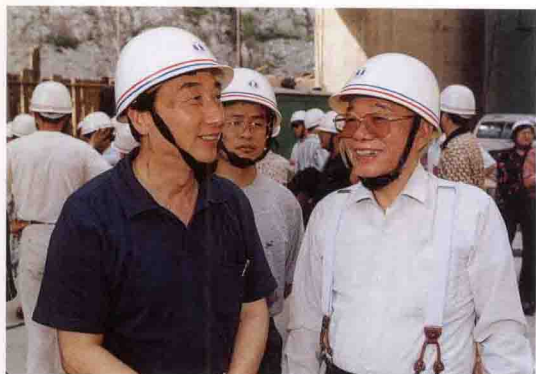
全国政协副主席张克辉(右)考察三峡工地