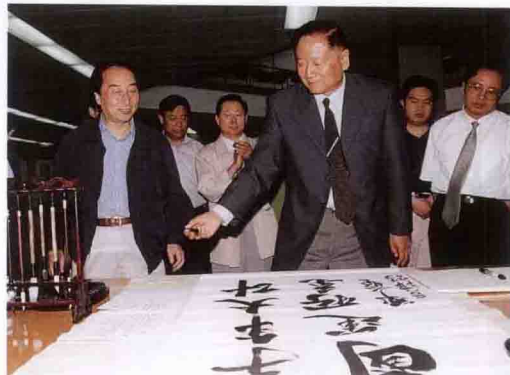
中央党校常务副校长郑必坚在三峡工程展览馆留墨