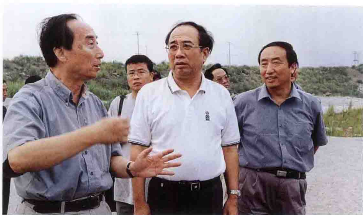
国务院新闻办、中央外宣办主任赵启正(中)参观三峡工程