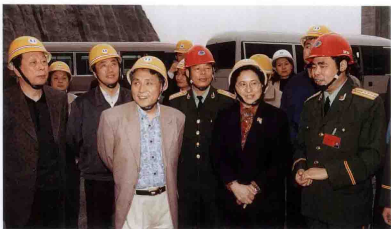
全国人大副委员长何鲁丽(女)考察三峡工程