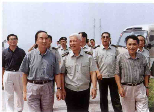
解放军副总参谋长钱树根（前排左二）一行考察三峡工程