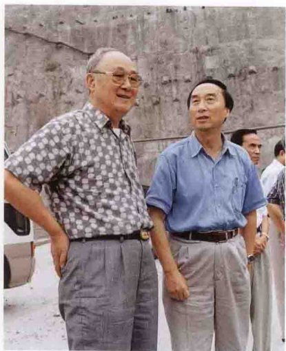
中国能源研究会理事长黄毅诚(左)考察三峡工地