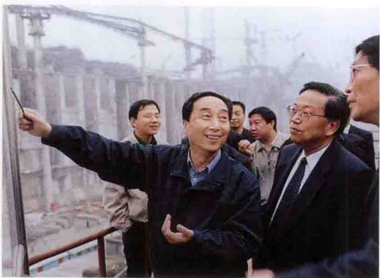
上海市委常委、副市长蒋以任（右二）考察三峡工地