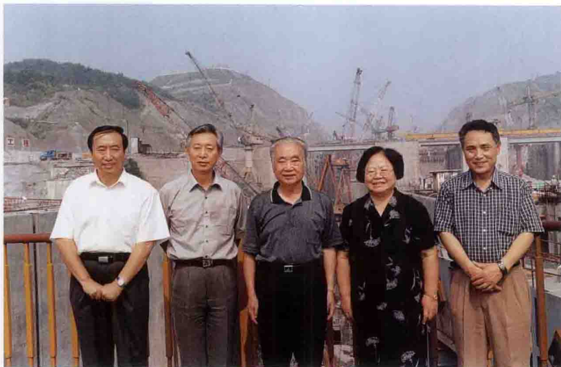
全国人大副委员长彭佩云(女)考察三峡工程