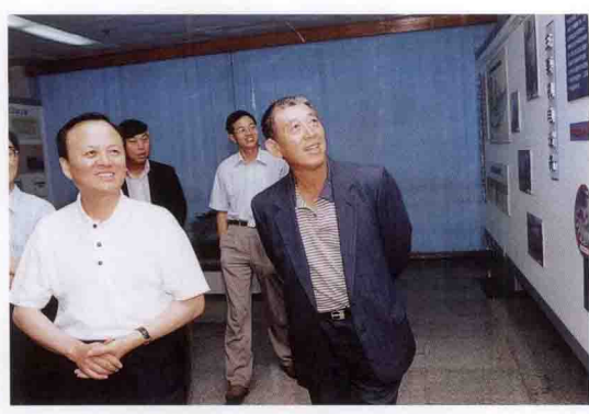
中信公司董事长王军(右)考察三峡工程