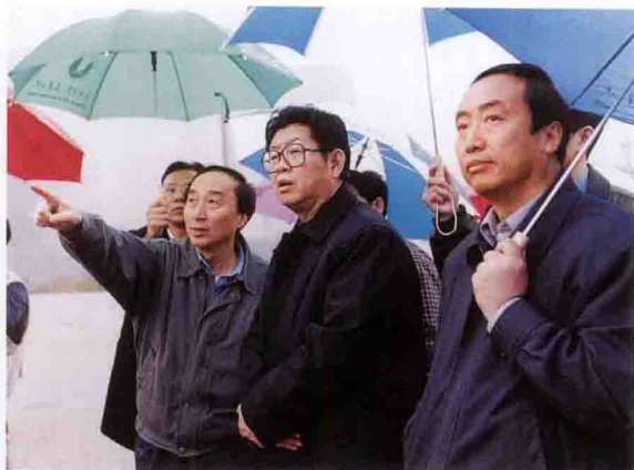
湖北省省长张国光（中）考察三峡工地