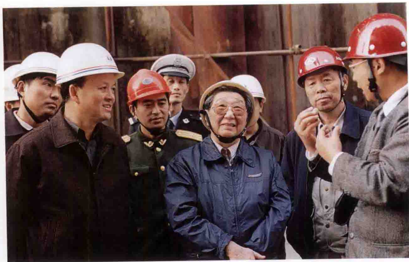
三峡枢纽工程质量专家组组长钱正英在三峡工地