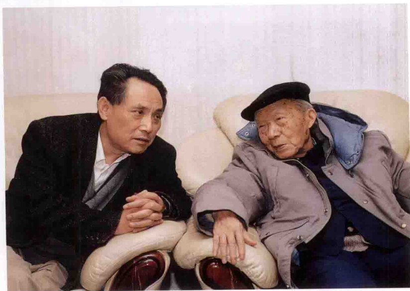
著名水电专家张光斗与中国三峡总公司领导交换意见