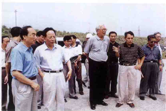
全国政协副主席罗豪才(前排左三)考察三峡工地