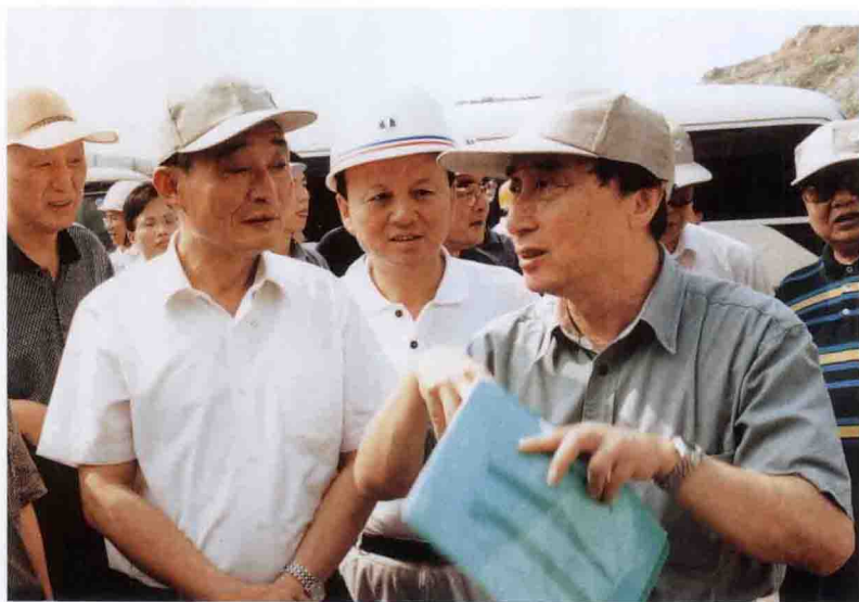
国务院副总理吴邦国考察三峡工地