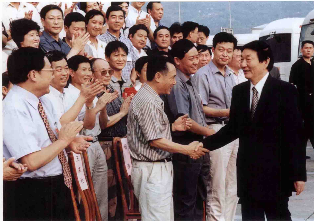
中共中央政治局常委、国务院总理朱镕基在工地接见三峡建设者