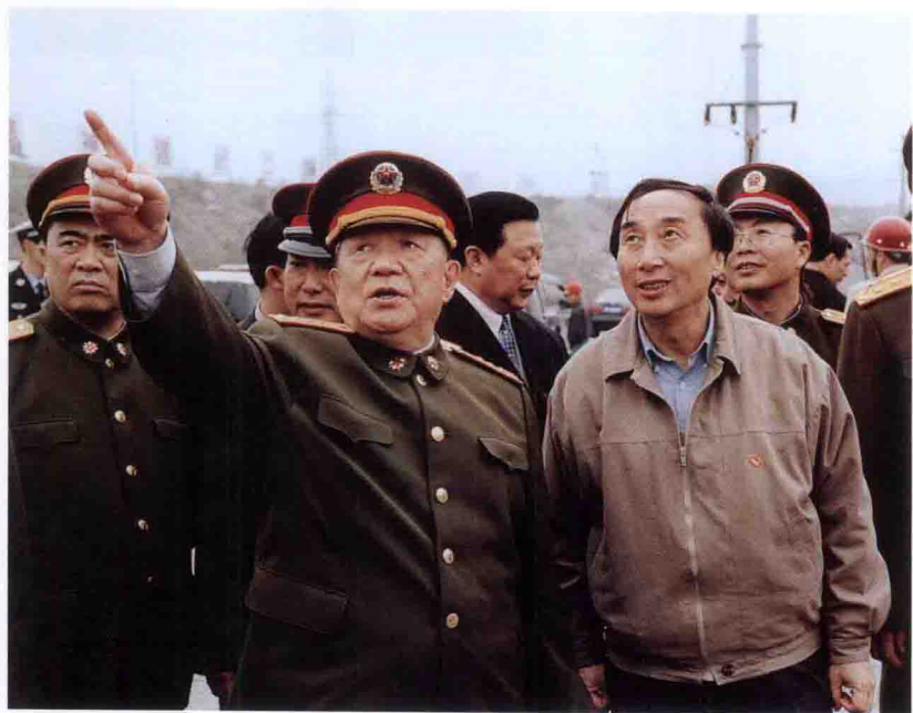
中共中央政治局委员、中央军委副主席迟浩田考察三峡工程