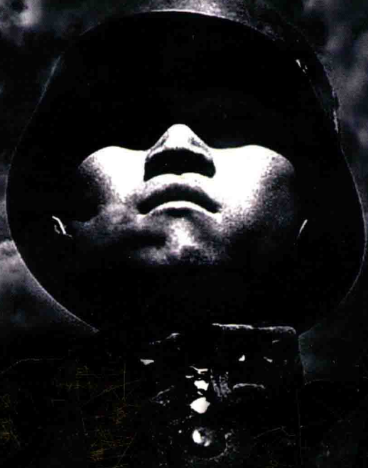
图 文 修 订 版