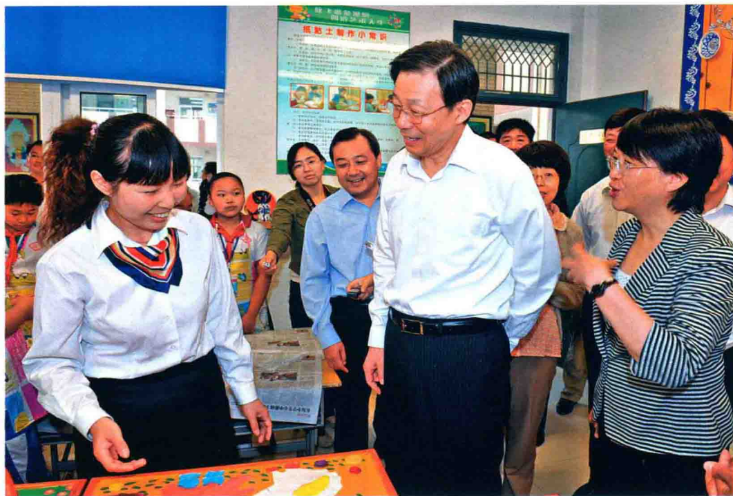
2011年9月8日，省长李学勇到仪征市新城中心小学，了解老师的教学和生活情况，向辛勤工作在教育战线上的老师们致以节日的慰问。