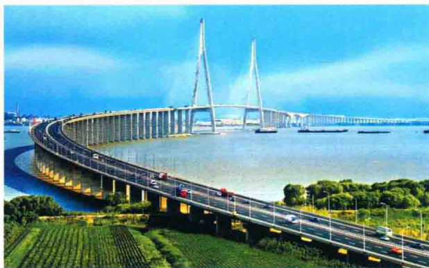
“长虹越大江”——苏通大桥英姿。