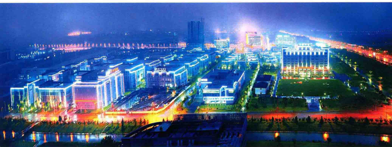
“中国药谷崛起苏中”——泰州中国医药城夜景。