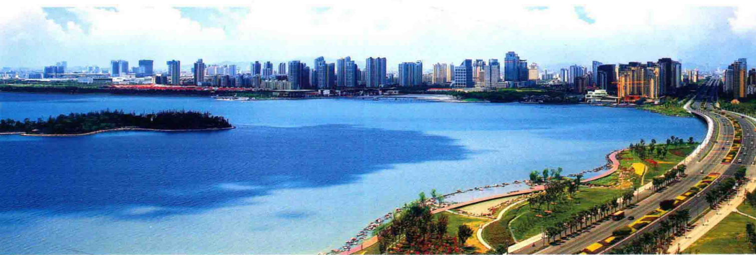
“中国最具竞争力的开发区”——苏州工业园区金鸡湖畔美景。