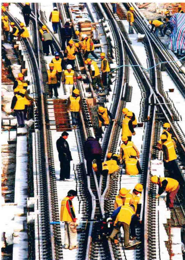
“争分夺秒建高铁”——京沪高铁镇江路段施工现场。