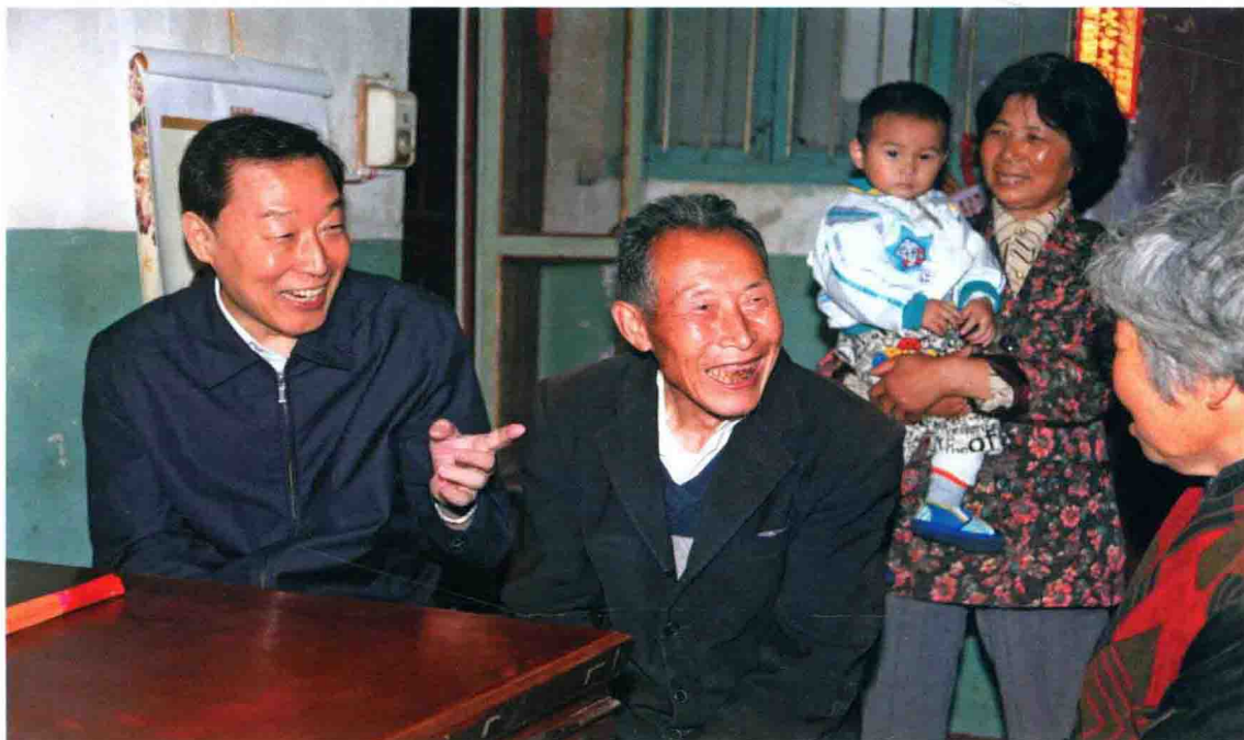
2011年6月15~19日，省委书记、省人大常委会主任罗志军到姜堰市沈高镇沈高村驻点调研。图为15日晚，罗书记走访农户，与村民亲切交谈。