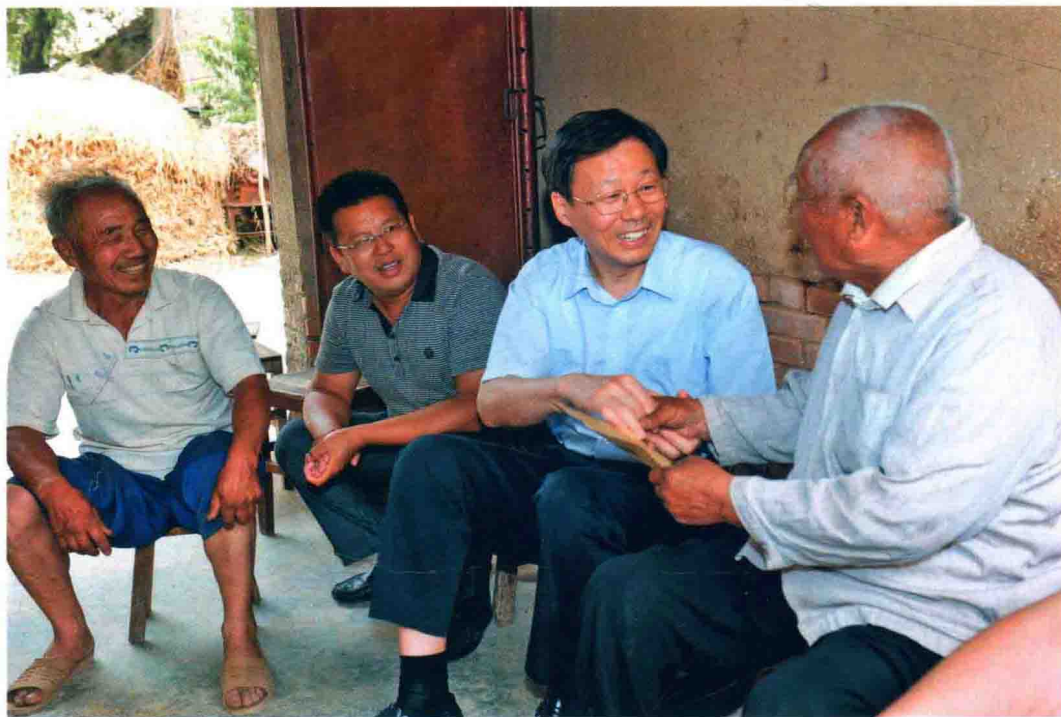
2011年6月16~19日，省委副书记、省长李学勇在沛县胡寨镇草庙村驻村住户调研。图为李学勇与87岁的残疾老人秦敬敏在唠家常。