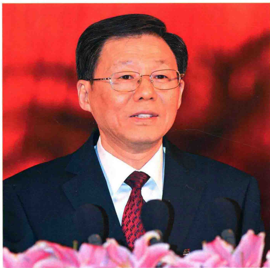
2012年2月9日，省长李学勇在江苏省第十一次人民代表大会第五次会议上作政府工作报告。