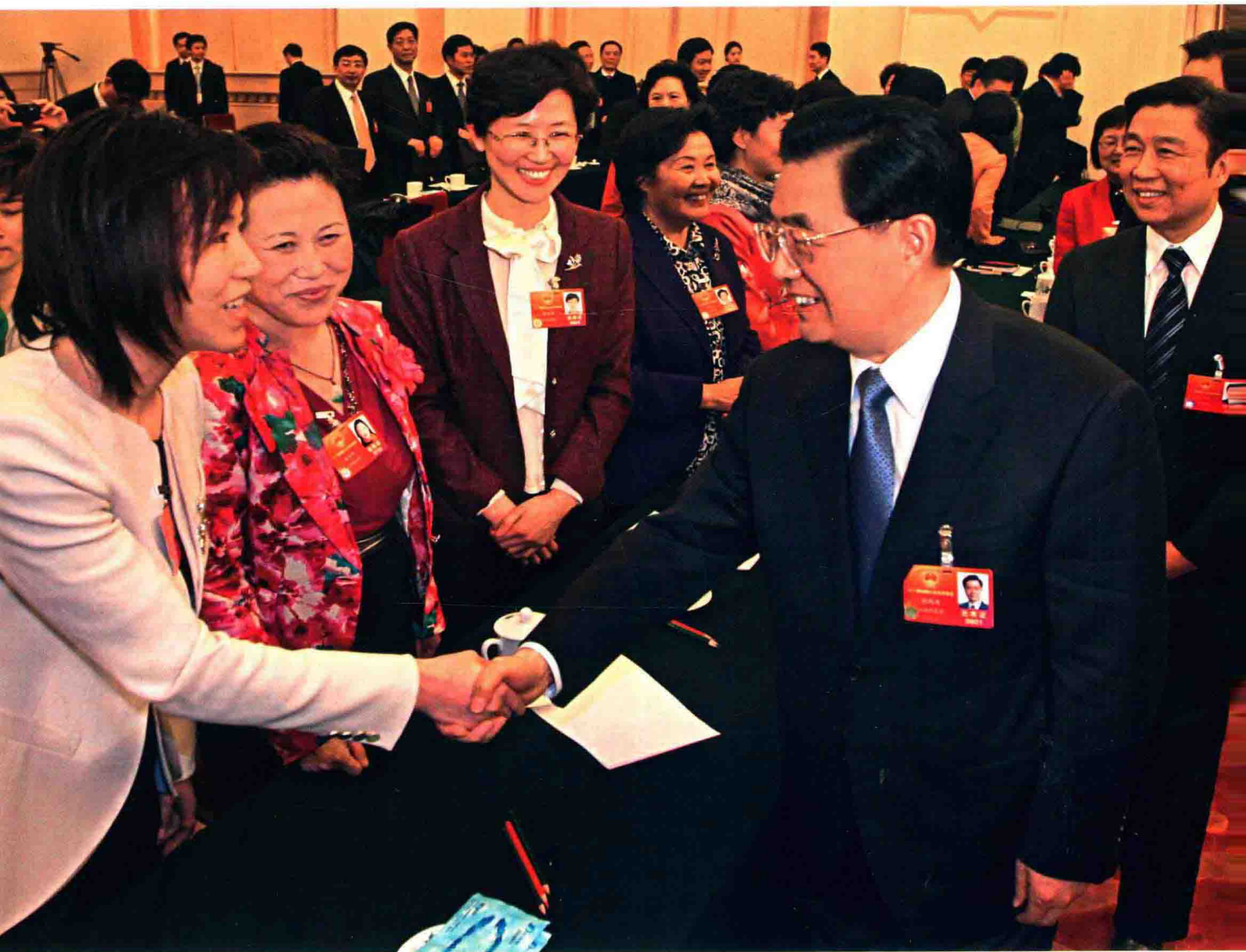
2012年3月5日，中共中央总书记、国家主席、中央军委主席胡锦涛与出席第十一届全国人大五次会议的江苏团代表亲切交谈。