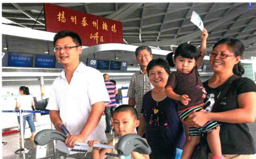
“家门口坐上大飞机”—— 2012年5月8日，扬州泰州机场 通航。