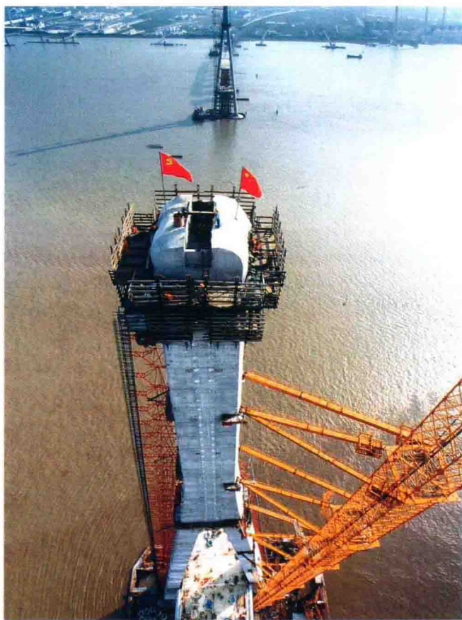
“擎天一柱红旗飘”——苏通大桥建设工地上的党员先锋队。