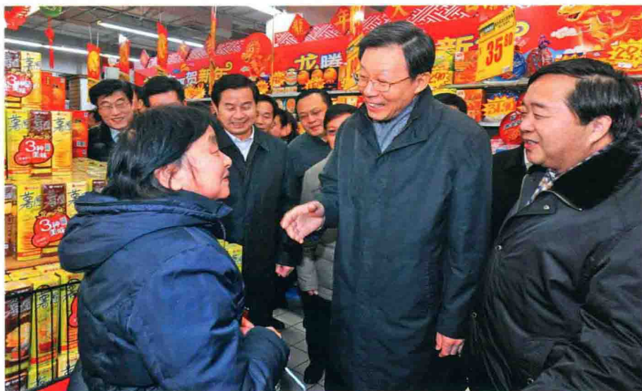
2012年1月21日，省长李学勇到省公安厅和电力等部门，考察春运及春节市场供应情况，向奋战在一线的干部职工和公安干警表示亲切慰问。图为在苏果超市南京清凉门店，李学勇同市民热情交谈。