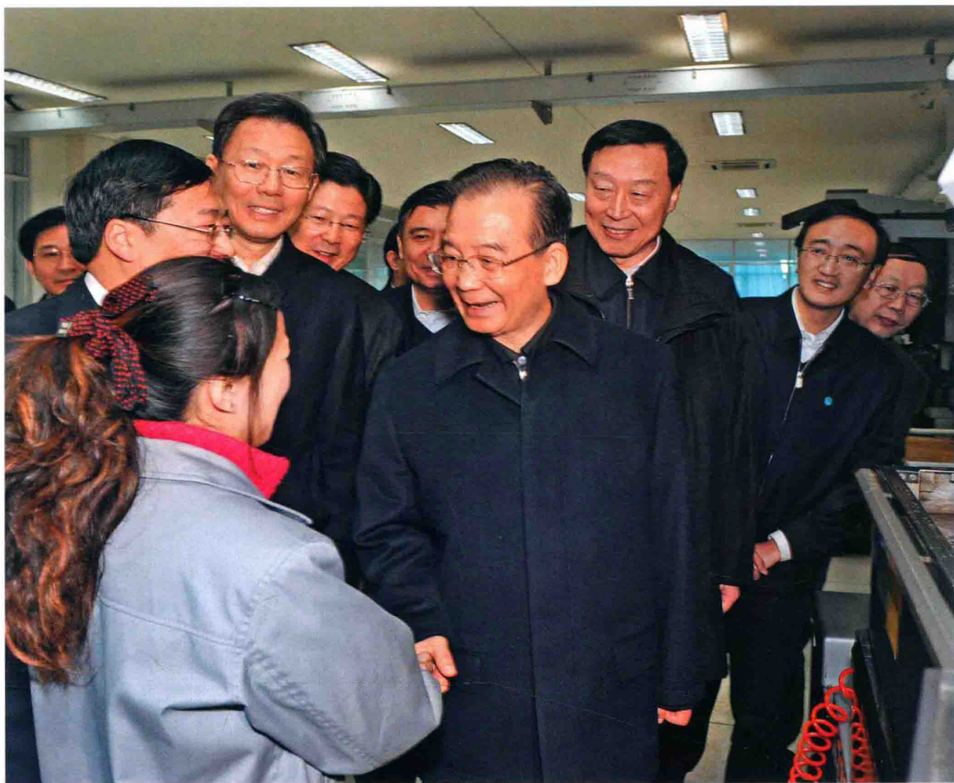
2011年12月18日,中共中央政治局常委、国务院总理温家宝深入生产企业,与一线工人亲切握手。