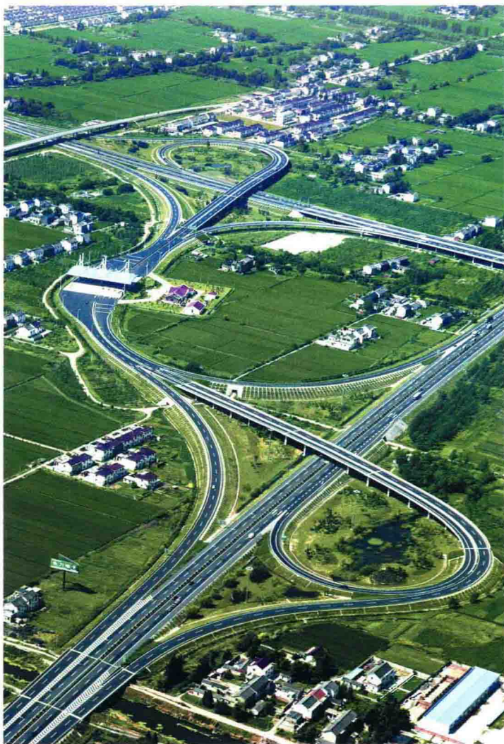
“大地旋律”——扬溧高速汉河交通枢纽。