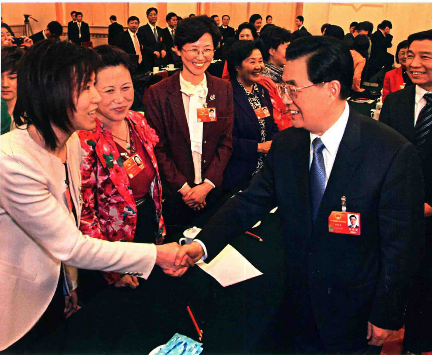
2012年3月5日，中共中央总书记、国家主席、中央军委主席胡锦涛与出席第十一届全国人大五次会议的江苏团代表亲切交谈。