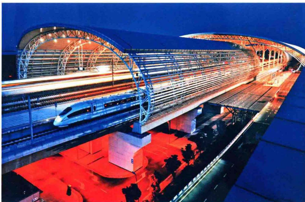
“千里北京一日还”——如今从北京到南京南站的高铁只需4小时左右。这是无锡锡东高铁站夜景。