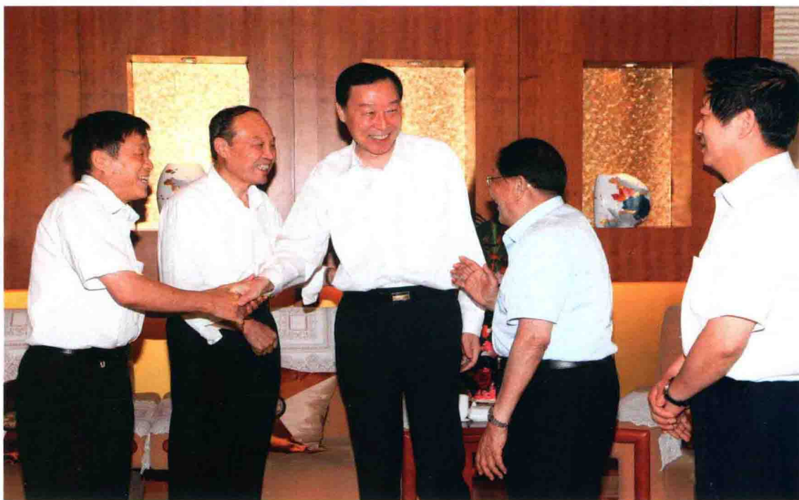
2011年6月27日，省委书记罗志军看望吴仁宝、秦振华、常德盛、张云泉等江苏省共产党员中的先进模范人物，代表省委、省政府向他们致以崇高的敬意和诚挚的问候。