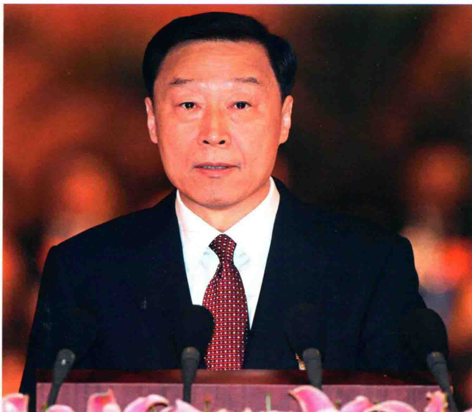
2011年11月6日，省委书记罗志军在中国共产党江苏省第十二次代表大会上作报告。