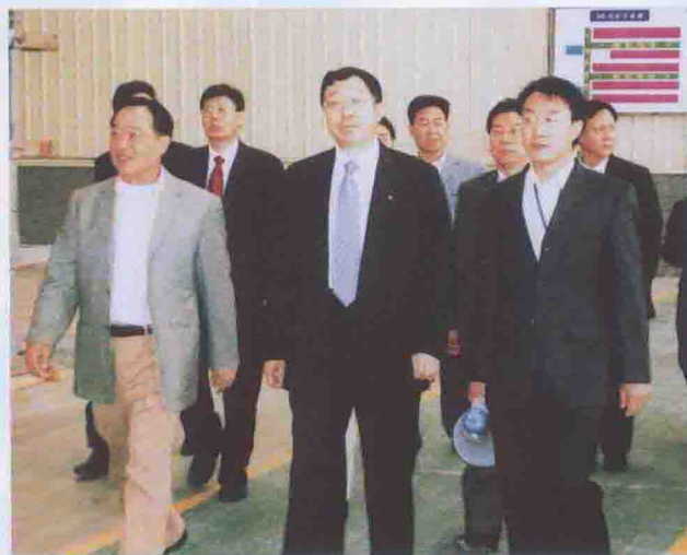
在清远市委书记陈用志陪同下中国南方电网董事长袁懋振（前排中）莅临公司参观指导

拥有国内，乃至全球最先进、自动化程度最高的生产基地。无论是硬件、软件和配套设施，都在同行业中处于超前和领先地位。产品销量多年来迅速攀升，现已居为行业前列。美高企业的产品早已突破了传统的门窗和建筑型材领域，广泛延伸并覆盖到电子工业、机械工业、矿山冶金、IT产业以及能源和交通运输等各行业。产品畅销美国、德国、加拿大、瑞士、新加坡、文莱、意大利等四十多个国家和地区。