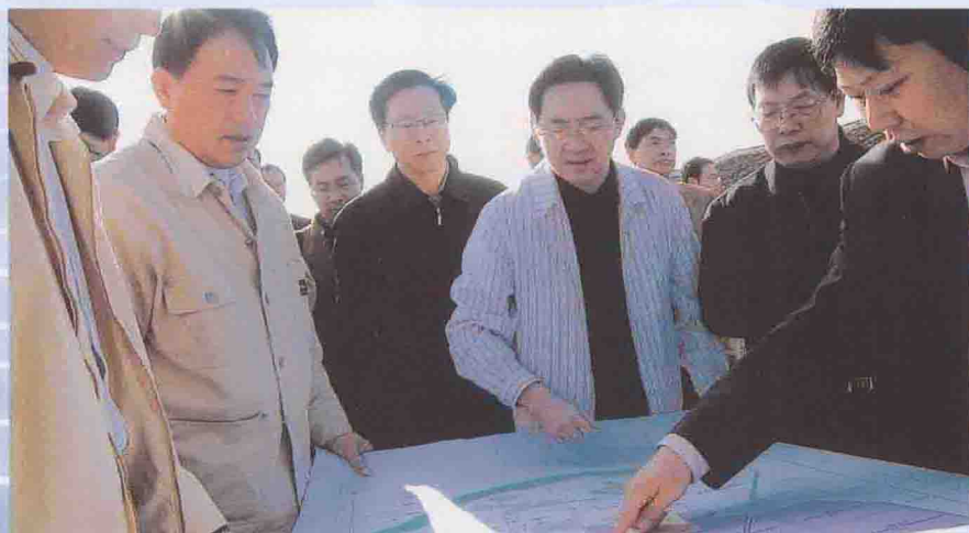
市领导在高新区调研

高新区是清远市招商引资的龙头，去年，高新区共引进项目65个，引进的项目中，已有11个投产，35个在建，19个筹建。现在全区有在建项目62个，准备动工建设的项目21个。在招商引资中高新区做到“五个调整，五个转变”：一是调整观念。强化产业聚集，实现招商引资向选商选资转