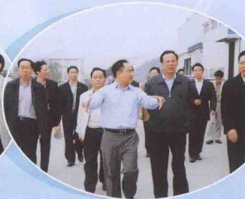
广东省副省长林木声（前排右二）莅临公司参观指导