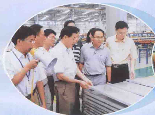
广东省长黄华华（右三）在董事长陪同下视察车间