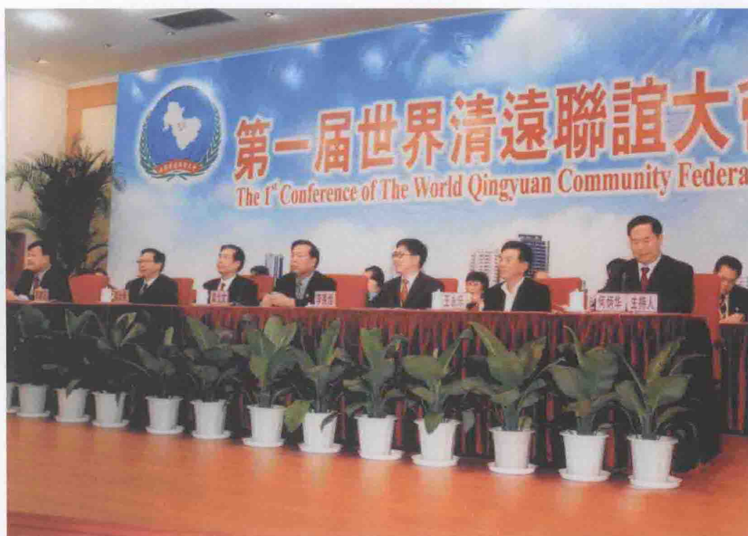
2006年4月2日，市政协牵头组织的第一届世界清远联谊大会在市国际会展中心召开