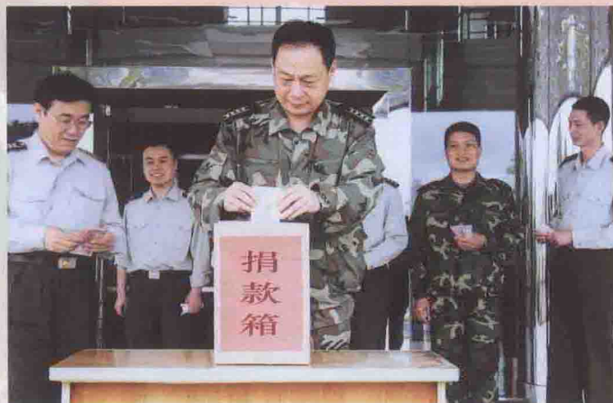
组织官兵捐款支援灾区重建