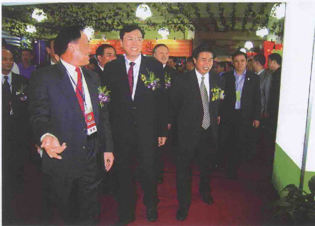
2006年11月17日，由清远市委书记、市人大常委会主任陈用志（左一）为团长有207人组成的清远代表团，参加了省在梅州市举办的第四届珠三角地区与山区及东西两翼经济技术合作洽谈会，清远市签约78个项目205亿元。期间，省委书记张德江（左二）、省长黄华华（右一）等省领导视察了清远展区