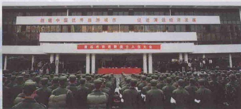
为部队输送高素质合格兵员