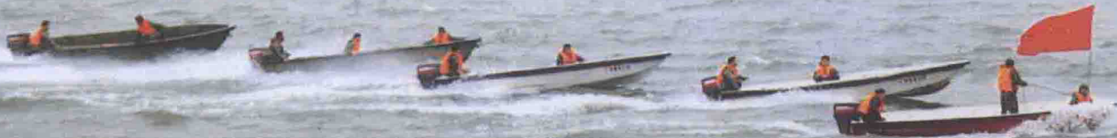
组织民兵轻舟分队队员训练