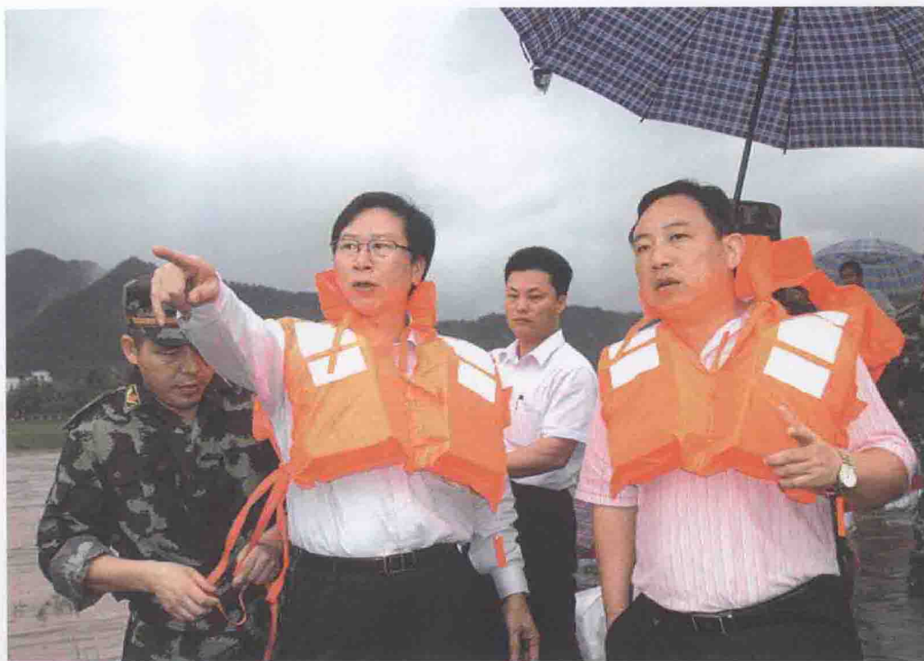
2006年8月4日晚上11时20分，受台风“派比安”暴雨袭击，清新县三坑威井堤决口，附近10多万群众被紧急转移，省、市、县领导亲临险堤指挥抢险，出动武警、消防官兵500多人投入抢险，11时50分成功堵住决口。图为市长陈家记（前左一）、副市长曾贤林（右一）等领导在险堤上指挥抢险