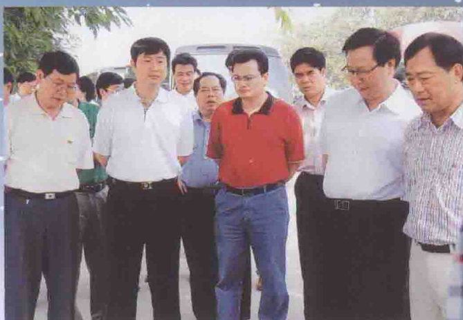
2007年5月18日市委书记陈用志、市长陈家记在高新区召开关于调整产业转移工业园现场办公会

变；二是调整方向。优化产业结构，实现从由规模效益向质量效益转变；三是调整结构。促进产业升级，实现从引进资金向引进技术转变；四是调整政策。创新机制，实现由政策招商向环境招商转变。五是调整管理。构建和谐开发区，实现由单纯工业区向多功能综合性产业区转变。高新区力争引进一批产业层次高，投资规模大，科技含量多，经济效益好，资源消耗低，环境污染少的项目。把着力点放在引进大项目上，放在引进高新项目上，放在优质服务上，真正做到办事规范化，审批程序化，投资便利化，服务优质化。