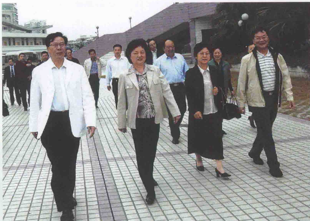
2006年11月21日，广东省副省长雷于蓝（左二）在清远市市长陈家记（左一）的陪同下检查省第三届少数民族传统体育运动会筹备工作。12月12日，广东省第三届少数民族传统体育运动会在清远举行