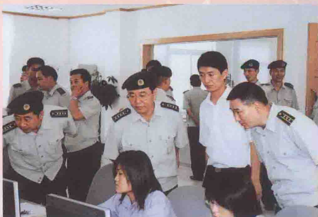
参观海螺集团，感受驻地经济发展的巨大成就