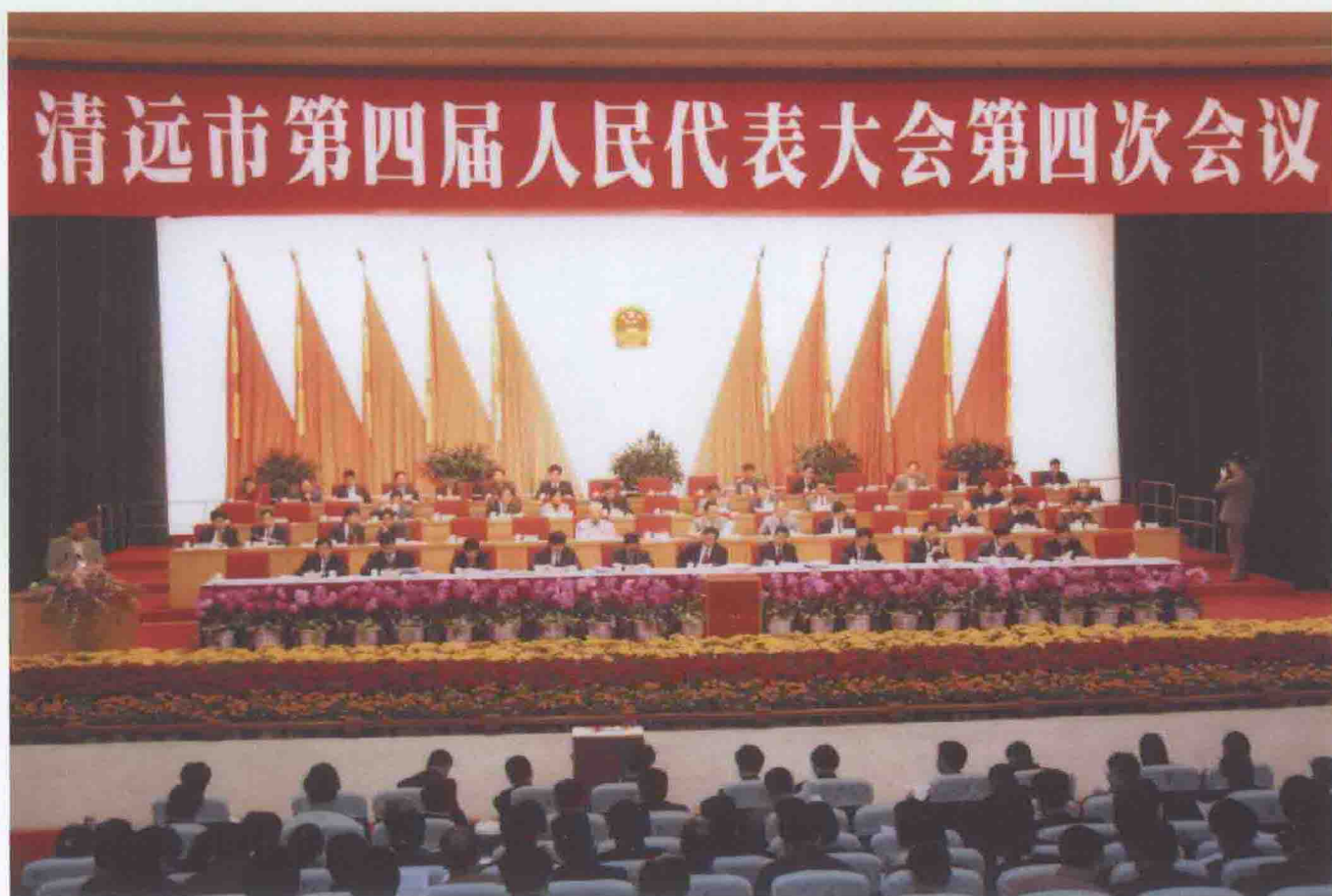
2006年3月8-10日，市第四届人民代表大会第四次会议在市国际会展中心召开