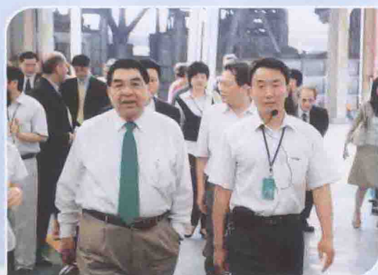
2007年5月10日，美国加州市长团来访参观