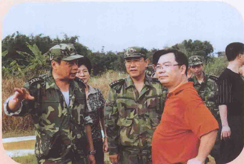
军分区司令员霍勇、政委郑向明现场指挥抢险行动