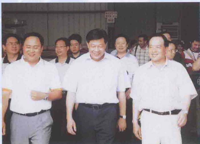
2007年5月9日，广东省委常委、省宣传部部长林雄（前排中）到公司视察