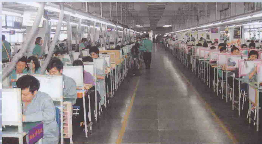
高新区企业生产场景

清远高新技术产业开发区如今已成一方投资热土，并努力把这方热土建设成为一座生机勃勃的活力之城。