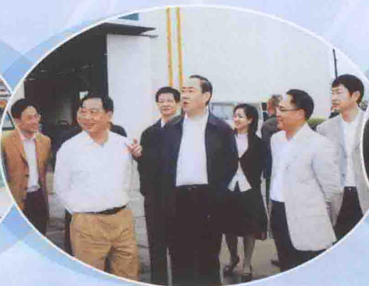
广东省副省长佟星（左四）在董事长陪同下莅临公司参观指导