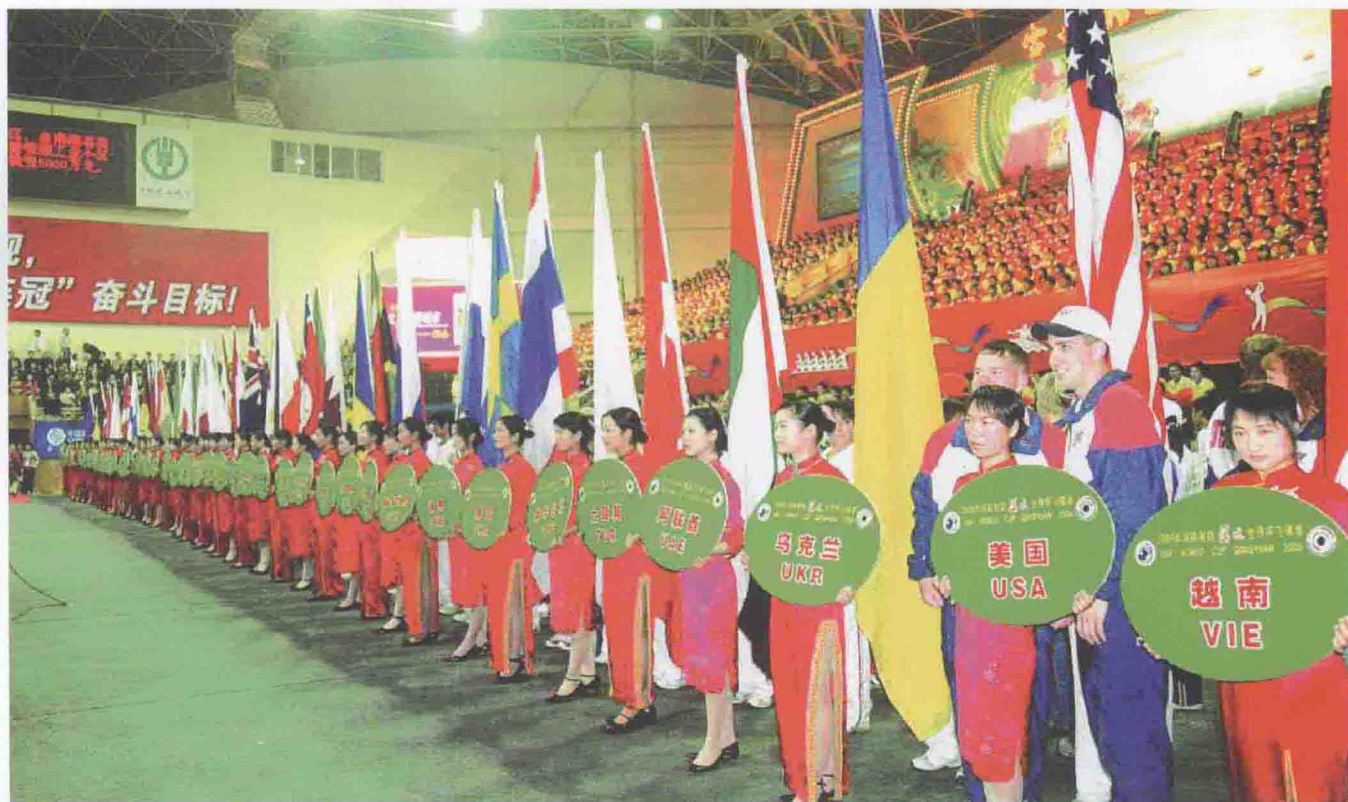
2006年4月3日，在清远市体育馆举办了清远世界杯飞碟赛开幕式欢迎歌会，图为各国运动员出席开幕式