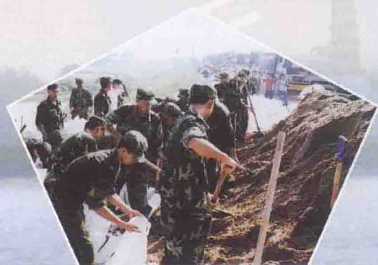
积极发动民兵预备役人员和驻地官兵参加抗洪抢险