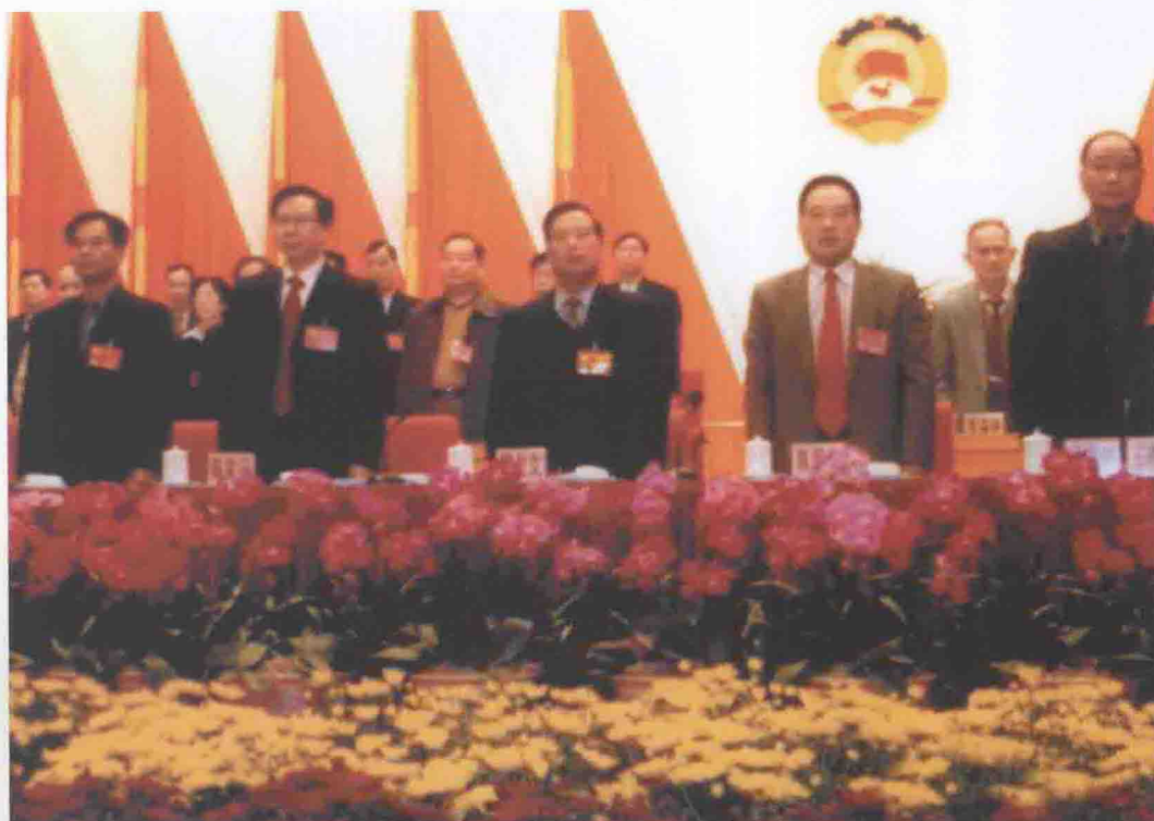
2006年3月7日，市政协四届四次会议在国际会展中心召开