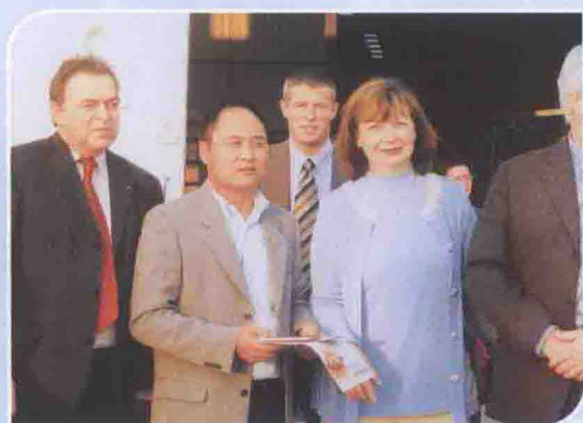
2006年12月4日，德国盖尔兹市市长玛蒂娜·史云堡姿（右二）到访留影