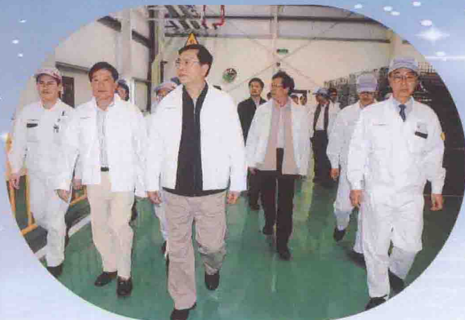
2007年3月19日，省委书记张德江视察清远高新区企业

清远高新技术产业开发区（简称高新区）的前身是清远经济开发试验区和清远生态工业园，2003年5月，经省政府批准，在这两个园区的基础上整合为高新区。