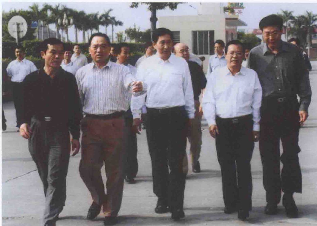
2006年11月8日，广东省委副书记刘玉浦（中）、省委党校常务副校长郑盛廷（右一）、清远市委书记陈用志（左二）、副书记邓光荣（右二）在市委党校常务副校长邓远天（左一）陪同下到清远市委党校调研