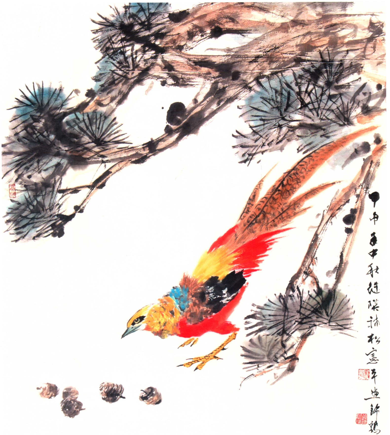
松鸡图（刘继瑛先生画松） 86cm×70cm 2004年