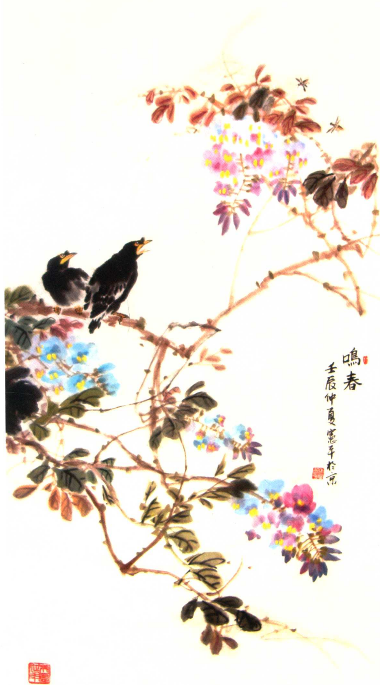
* 春夏秋冬四条屏 98cm × 50cm × 4 2012 年