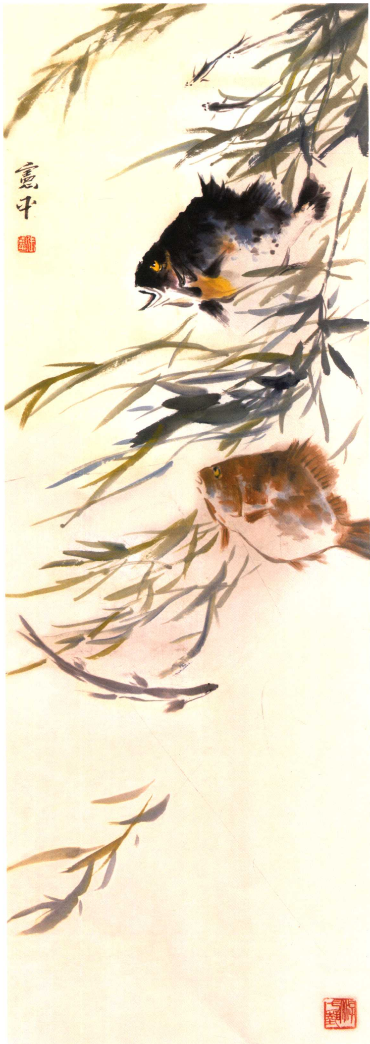
鱼趣（仿王雪涛先生笔意） 93cm × 33cm 1979年