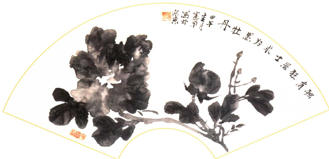
墨牡丹 21cm×52cm 2014年