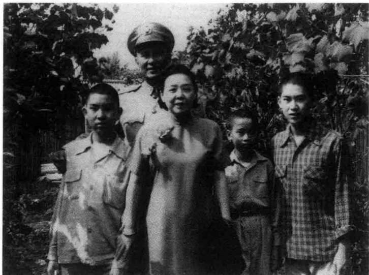
五〇年代在台北松江路家中与父母等人合影，右一为白先勇