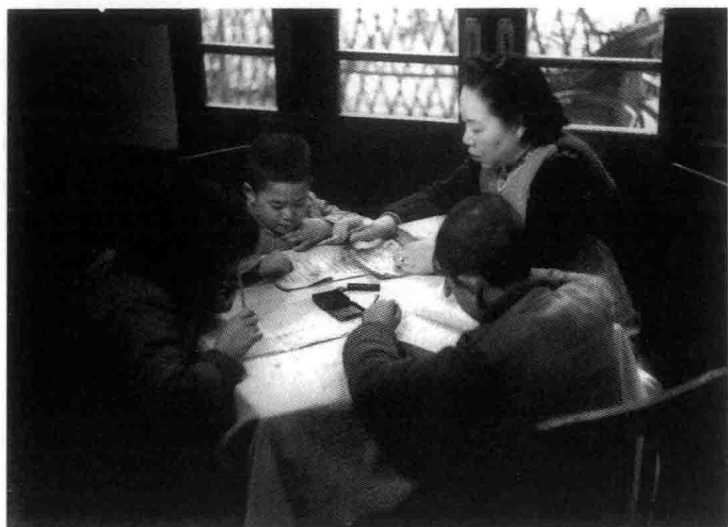
童年时与母亲合影