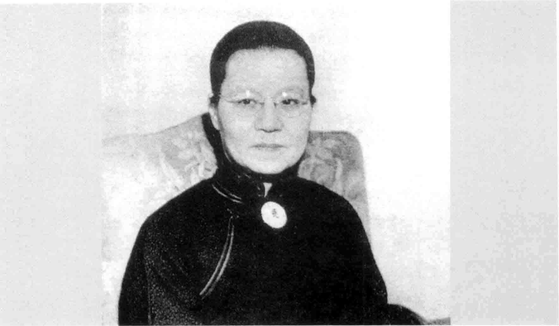
吴贻芳 (1893–1985年) 博士

1919年毕业于金陵女子大学，是中国第一批在本土获得学士学位的女大学生。1928年获美国密歇根大学生物学博士学位后受聘于母校任校长长达23年（1928–1951）。新中国成立后，吴贻芳历任江苏省教育厅厅长、江苏省副省长等职务，主要从事教育领导工作。在吴贻芳的建议下金陵女子学院于1987年成立。