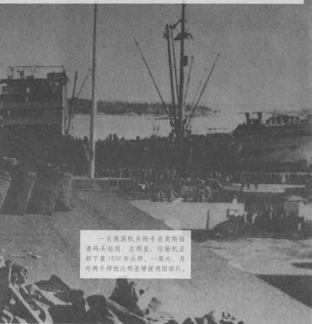
一名德国机关枪手在奥斯陆港码头站岗，在那里，运输机正卸下第163d步兵师。一周内，另外两个师抵达那里增援德国部队。

然而，挪威人情愿承担袭击的主要压力。皇室成员和政府领导人比侵略军先一步撤出奥斯陆，发誓他们的优势部队将“抵抗到底”。