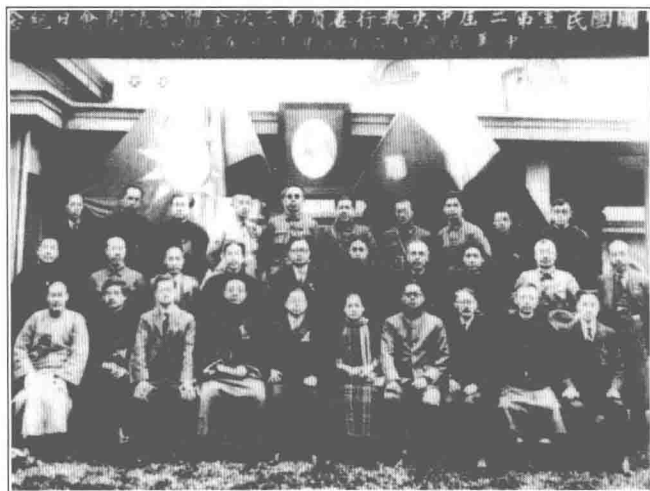
(4) 1927年3月10日，毛泽东（中排右三）参加国民党二届三中全会。