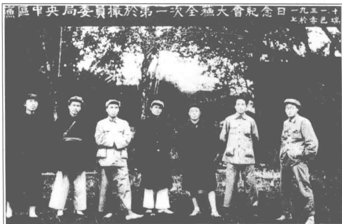
(5) 1931年11月，毛泽东与中共苏区中央局成员合影（右二为毛泽东）。