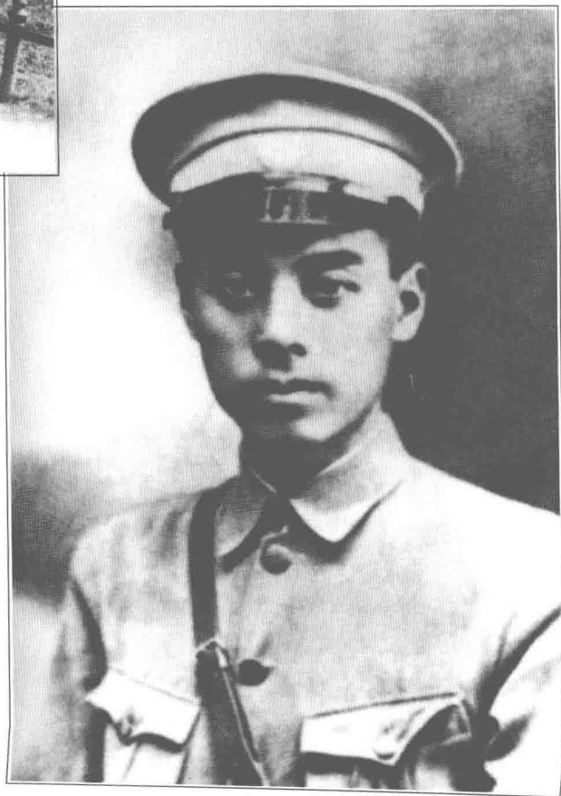
(11) 1925年9月,周恩来被任命为国民革命军第一军少将政治部主任。图为担任黄埔军校政治部主任时的周恩来。

(10) 周恩来(右二)和张申府(右四)、刘清扬(右三)、赵光宸(右一)在德国柏林合影。周恩来旅德期间,积极从事党团的组织工作,建立旅德支部,并于1922年介绍朱德入党。