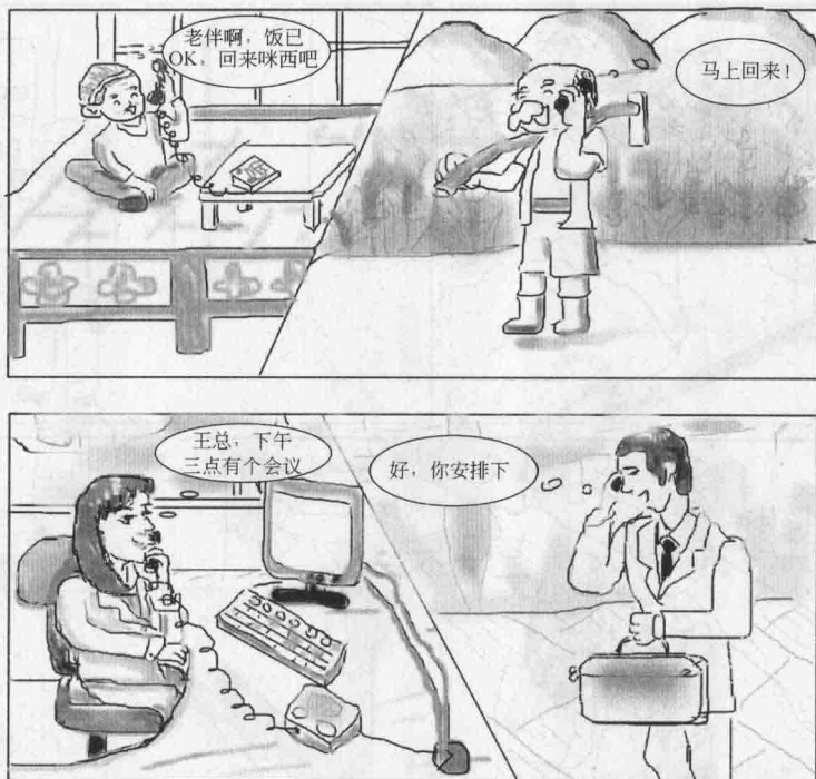
图 1.1 各行各业的通信

洗漱完毕，7:45，笔者走出宿舍门，按一下电梯的下行键，笔者走进电梯。笔者按电梯的按键也是一个通信的过程，按键被按下这个动作向电梯的处理系统发送有人要坐电梯下楼的信息。