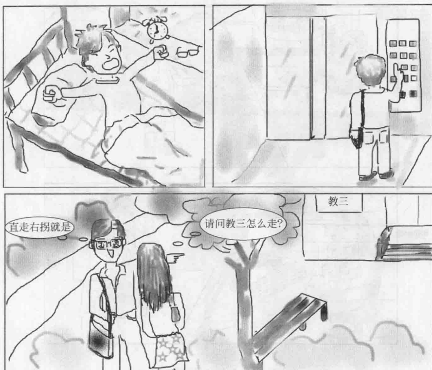
图 1.2 笔者的一天

(3) 信道：信道就是信源与信宿通信的媒介，空气、电缆、光缆、石头、钢管等都可以充当通信的信道。