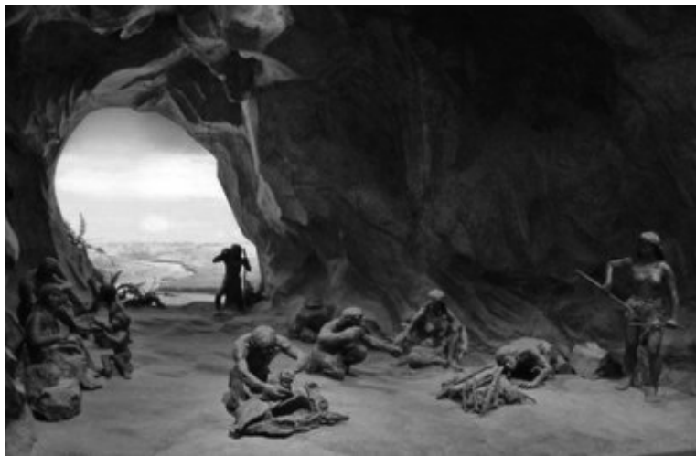
图13—1 山顶洞人遗址

原始社会的人类，为了抗御自然界寒冷暑热及野兽的侵袭，而择居于山洞或树上。据传我国远古有巢氏发明了巢居，轩辕氏发明了穴居。巢居是人们依树而居的方式，这种方式在地势低洼和气候湿热地区或季节被广泛使用。《庄子·盗跖》：“古者禽兽多而人民少，于是民皆巢居以避之。昼拾橡栗、暮栖木上，故命之曰有巢氏之民。”在地势高亢和寒冷的地区或季节，人们则选择天然洞穴作为栖身之地，如北京猿人、山顶洞人（图13—1）等均是依洞而栖的。正所谓“夏则居槽巢，冬则居营窟”。