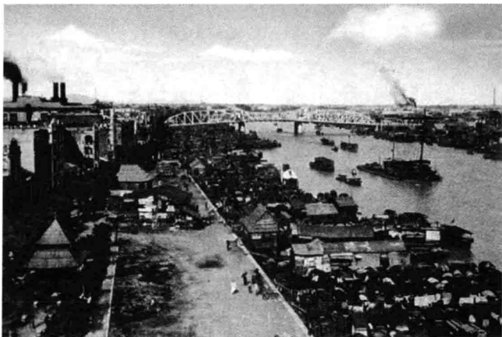
二十世纪三十年代初，长堤河岸南拓后，建起海珠桥和五仙门发电厂

仅局限于一德路，甚至惠福路一线，退缩至广州旧城墙的墙脚之下。放眼前方，五六百米宽的“海面”，烟波浩渺，是名副其实的“海”。寸金尺土，伴随着每隔五六十年就来一次的向南拓展，一如所愿，新河堤向“海面”延伸，为政府和商家带来滚滚财源的同时，也给市民大众开辟了一片生活和出行的空间。