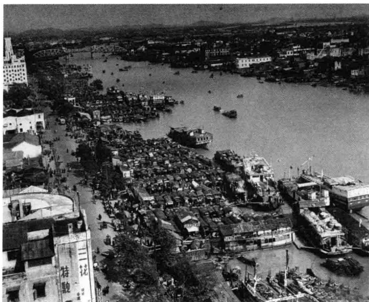
长堤南拓取直河岸线船艇云集

共达四十八万，三年无间断。所差费用，当局登报发行总额达二百万元，利息六厘的建设公债补足。公债名曰“珠江新场建设公债”，面向广大市民，分为百元、十元和五元三种，前一年半即可领取利息，三年期满全额归还本息。由于手续简单，获利甚丰，公债发行当天，市民闻讯而来，发行点人头攒动，不到一周便已售罄。市政当局为了取信于民，还登报划出沿江几块余地做公债发行保险抵押。动工初期，即已从香港购入最新型英国挖掘机，以便加快工程进度。新场填土需要大量余泥，结合疏浚珠江河道、平整市内山冈和招倒余泥，“三管齐下”得以妥善解决。一片平坦的新堤，取直原本弯曲的河道，三年后终于现身珠江北岸，呈现在市民眼前，还沿江建起了一道美观的绿化带。