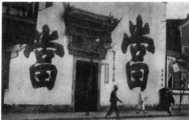
坚壁厚墙，状如碉楼的当铺

当铺赚钱有大押和小押之分，通常是押本九折、取赎十足还需加利，最终九出十三归，此谓明取，典当大件家私重物还要加收一定保管费。若有携来金器典押者，企柜（当班专职员工）会取出黑色“试金石”，让金器在其上擦一两下，留下划痕与样本对照，透过放大镜仔细察看判断其成色，稍有怀疑，当即抹于硝酸划痕上，使杂质熔蚀，所剩便是纯金了，以此判定金器成色和确定押价。对于手镯、金锭、金条等大件金器，更慎之又慎，还摇动专门锥钻钻一细孔，直透内层，取出放大镜透视里面，以防其中裹夹铅、锡，防伪防骗，处处做足。经此钻孔和试金石上擦痕两道程序，物品主人的损耗虽然微不足道，但集腋成裘，店铺日积月累，其利可观。