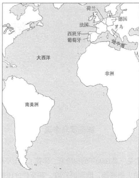
费尔南多与费利佩的帝国