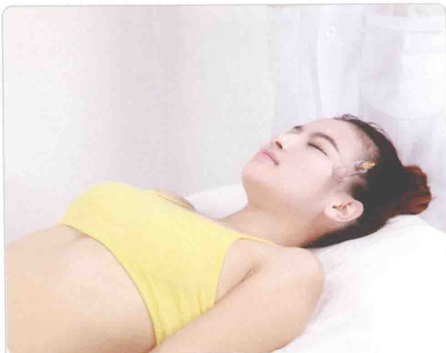
火罐拔取丝竹空穴，可以改善和缓解眼部疾患

经穴，顾名思义是经络之穴，这也就指明了经穴主治与经络之间的关系。经穴的远治作用与经络的循行分布是紧密相关的，穴位在远治作用中除能治疗本经病变以外，还能治疗相表里的经脉疾患。例如，手少阴心经上肘以下的穴位，一般都能预防和治疗心血管系统、神经系统、大脑等部位的疾病，而手少阴心经所出现的病症，又同该条经脉上的穴位主治功能基本一致。经络与全身各部有表里相合、相互制约等多