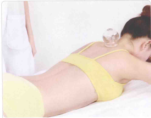
火罐拔取大椎穴可以退热解表