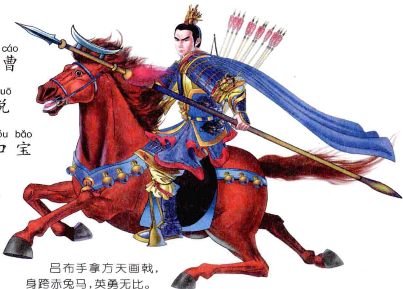
吕布手拿方天画戟， 身跨赤兔马，英勇无比。