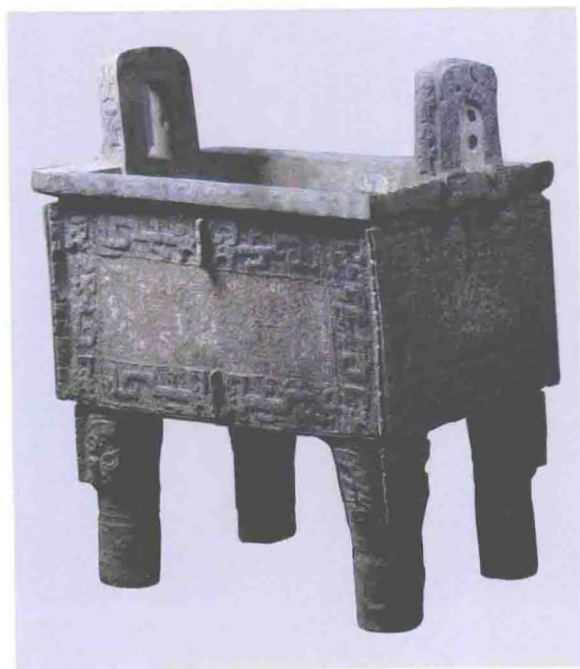
司母戊大方鼎（商代后期，安阳出土）