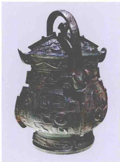
戊夙卣（商代晚期，上海博物馆藏）