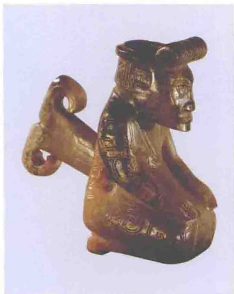
商代玉人（商代后期，安阳妇好墓出土）