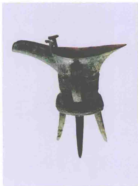
兽面纹爵（商代早期，上海博物馆藏）