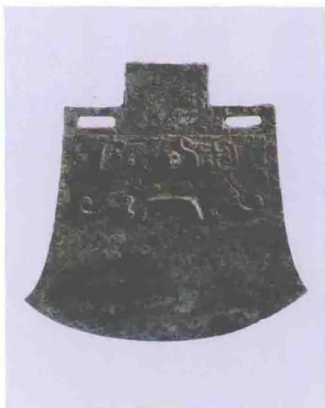
妇好钺（商代后期，安阳妇好墓出土）

注：封面彩图为司母戊大方鼎。插页彩图未注明出处的均引自胡厚宣、胡振宇著《殷商史》（上海人民出版社2003年版）。