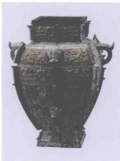
商方罍（商代晚期，上海博物馆藏）