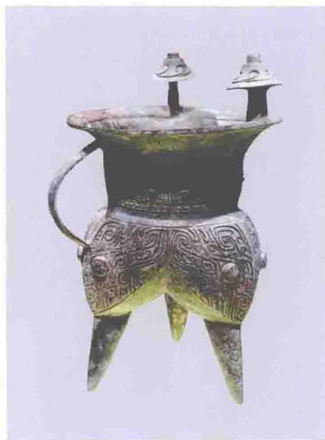
饕餮纹束腰袋足罍（商代中期，上海博物馆藏）