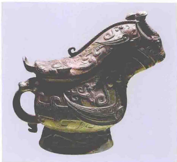
父乙觥（商代晚期，上海博物馆藏）