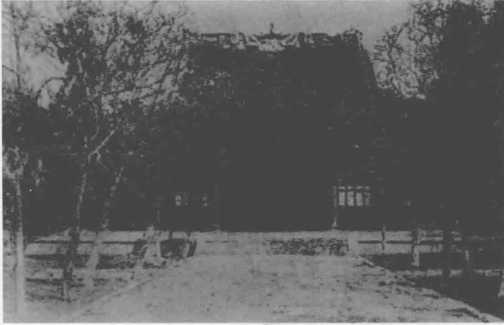
復旦公學大禮堂，嚴復曾在此任教