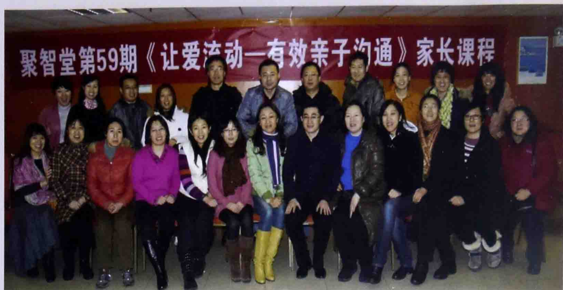
■ 2013年3月北京家长课程合影