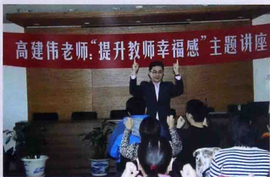
■ 2015年北京97中教师培训