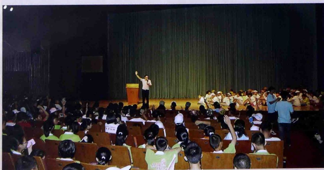
■ 2014年7月在北京大学百年讲堂给孩子们做“好习惯成就梦想”培训