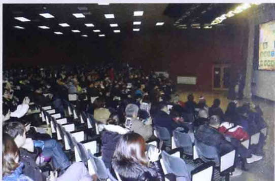
■ 2015年北京海淀外国语实验学校家长培训