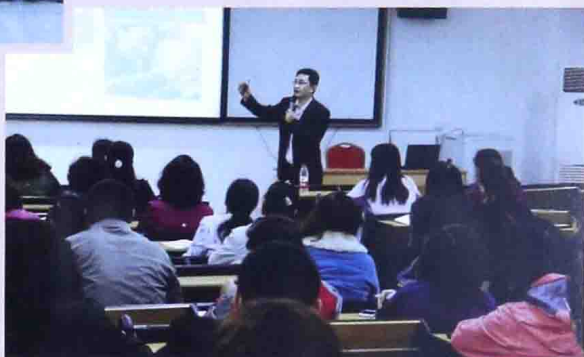
■ 2013年6月在北京101中学做“杰出 教子七大工具”讲座