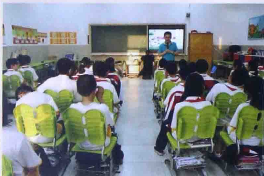
■ 2013年在北京海淀外国语实验学校做“心智成就未来”心智训练辅导