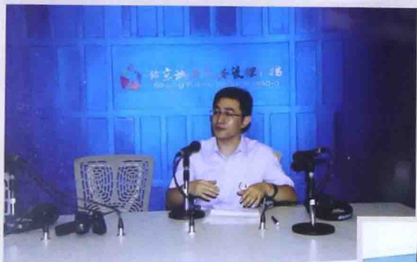
■ 2012年受邀FM107.3“教育面对面” 做家庭教育节目专访