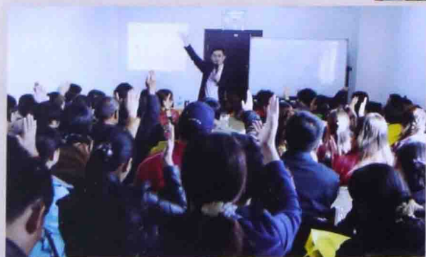
■ 2012年北航附中家长《杰出教子方程 式：1+2+3+4=?》沙龙