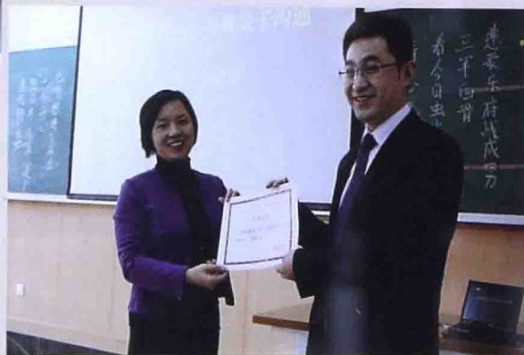
■ 2013年在十一学校做“让爱流动——有效亲子沟通”培训