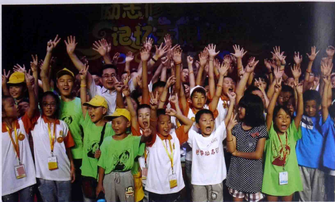
■ 2014年8月杰出心智训练营和孩子们在一起