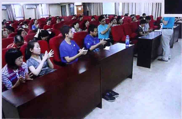
■ 2013年6月为北京考生做中考减压讲座