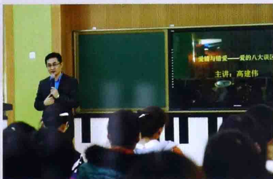
■ 2015年3月北京苹果园二小“爱的八大误区”家长讲座