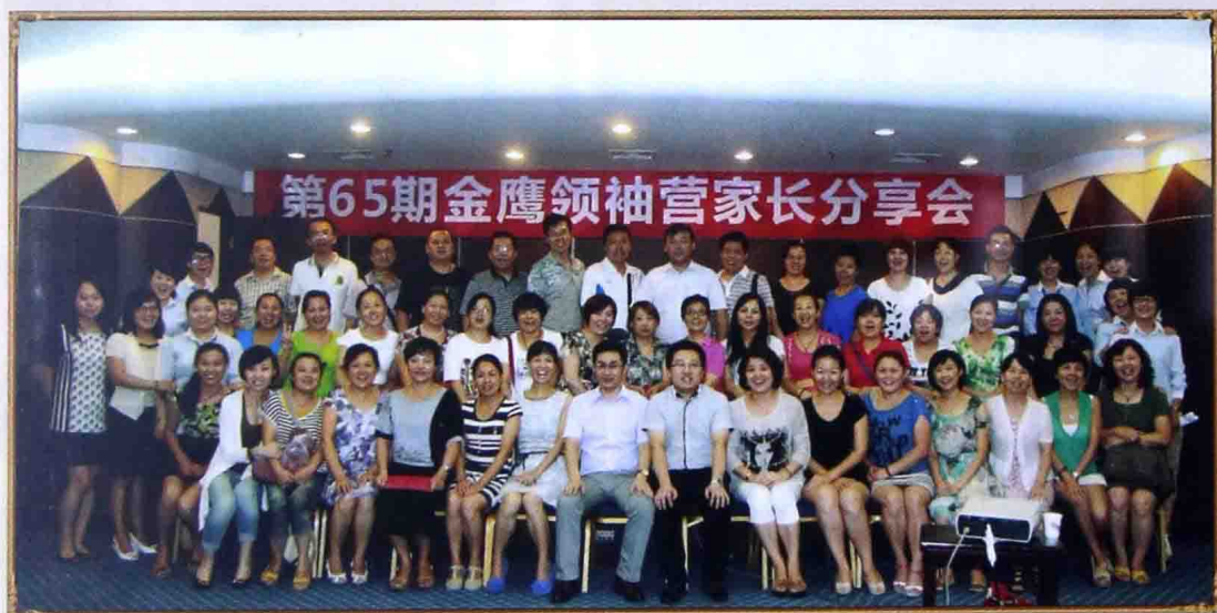
■ 2014年6月西安——家长分享会