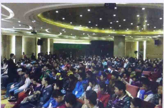
■ 2015年天津亲子训练营培训