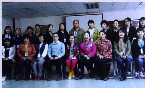
■ 2013年4月在北京百万庄图书大厦做 亲子沟通培训合影