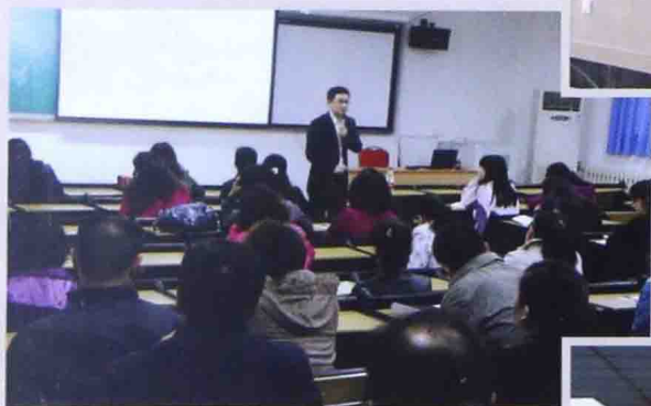
■ 2013年在人大附中西山学校做“解密 孩童行为信号”讲座