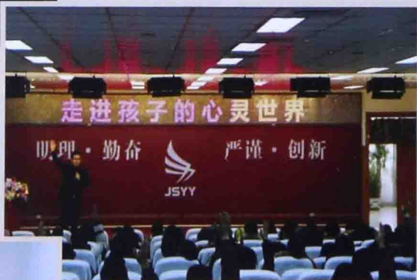
■ 2013年在景山远洋学校做“走 进孩子的心灵”讲座