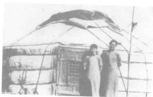
冰心与雷洁琼在蒙古包前