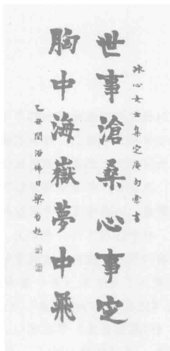
梁启超为冰心题写的对联