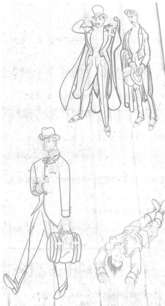
Imagem de Fernando Pessoa

动词 ser 表示“是”，根据人称的不同发生变化，葡萄牙语中称为变位。本课中出现的 sou 是该动词其中一个人称“我” (eu) 的陈述式现在时变位。