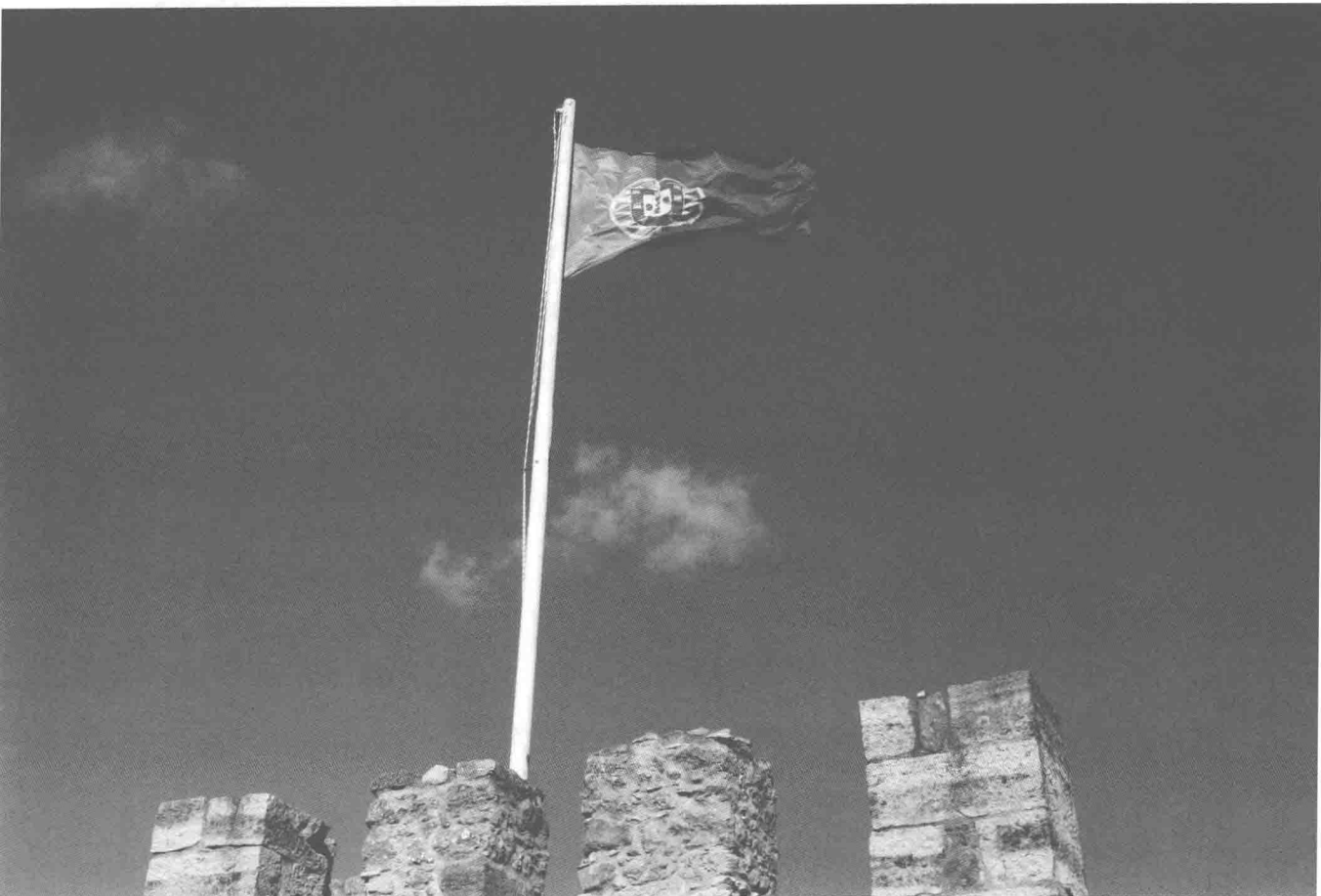
Castelo de São Jorge