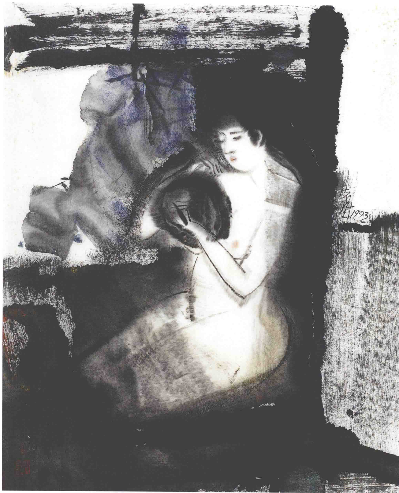
对镜图 57.5cm × 44.5cm 1993年