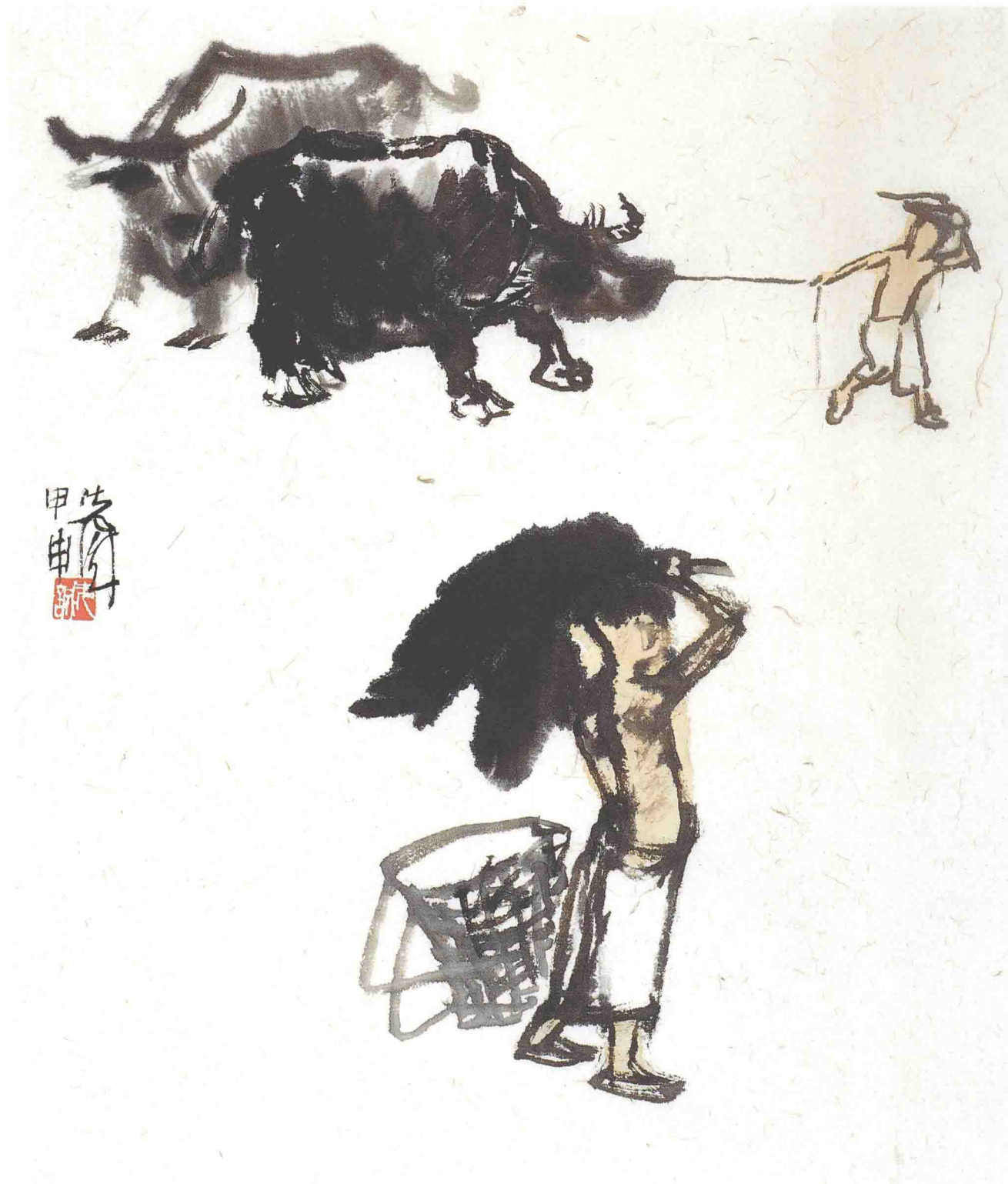
牧趣 34cm × 27.5cm 2004年