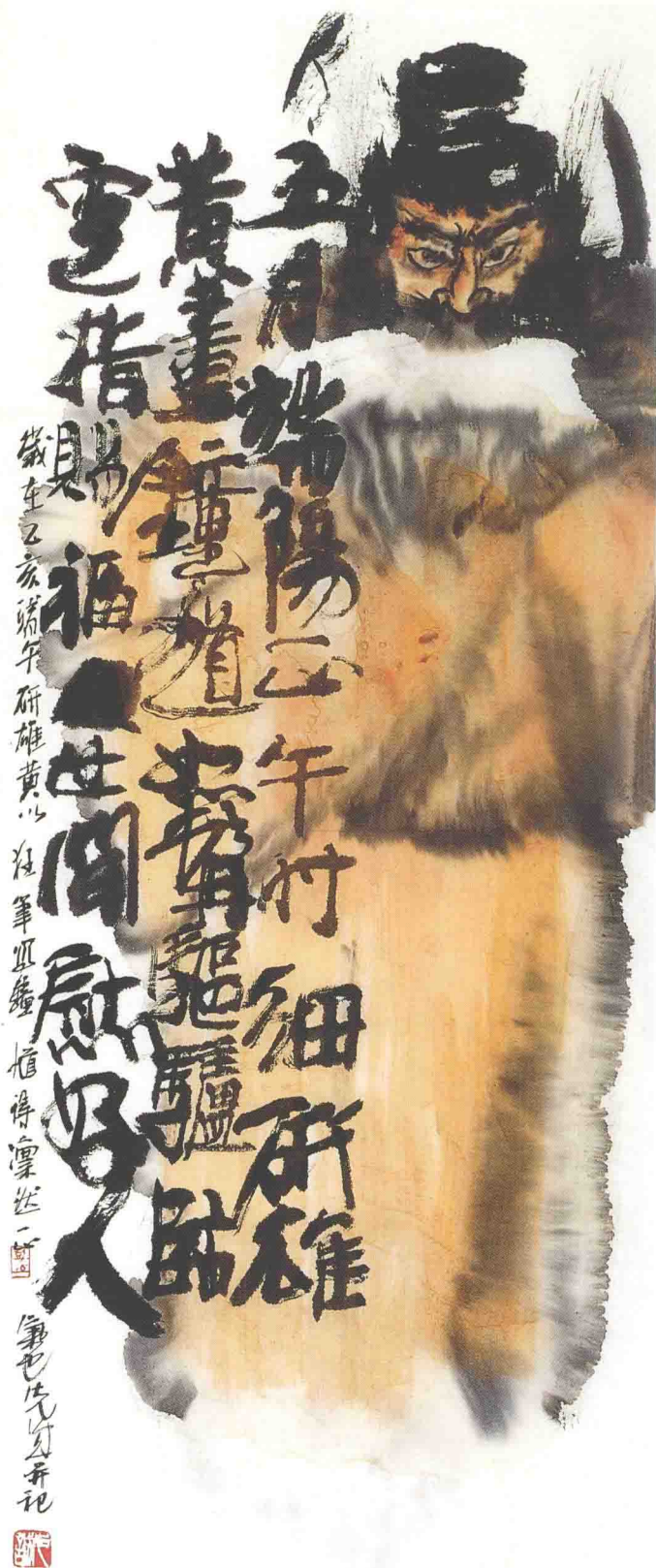
道士 59cm × 27.5cm 2001年