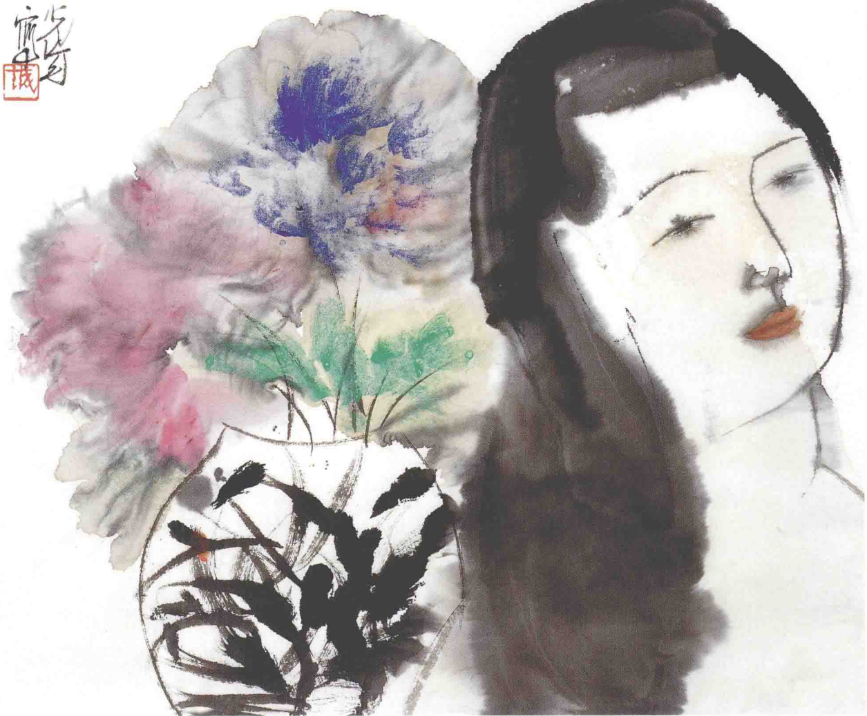
瓶花仕女图 34cm × 41.5cm 2001年