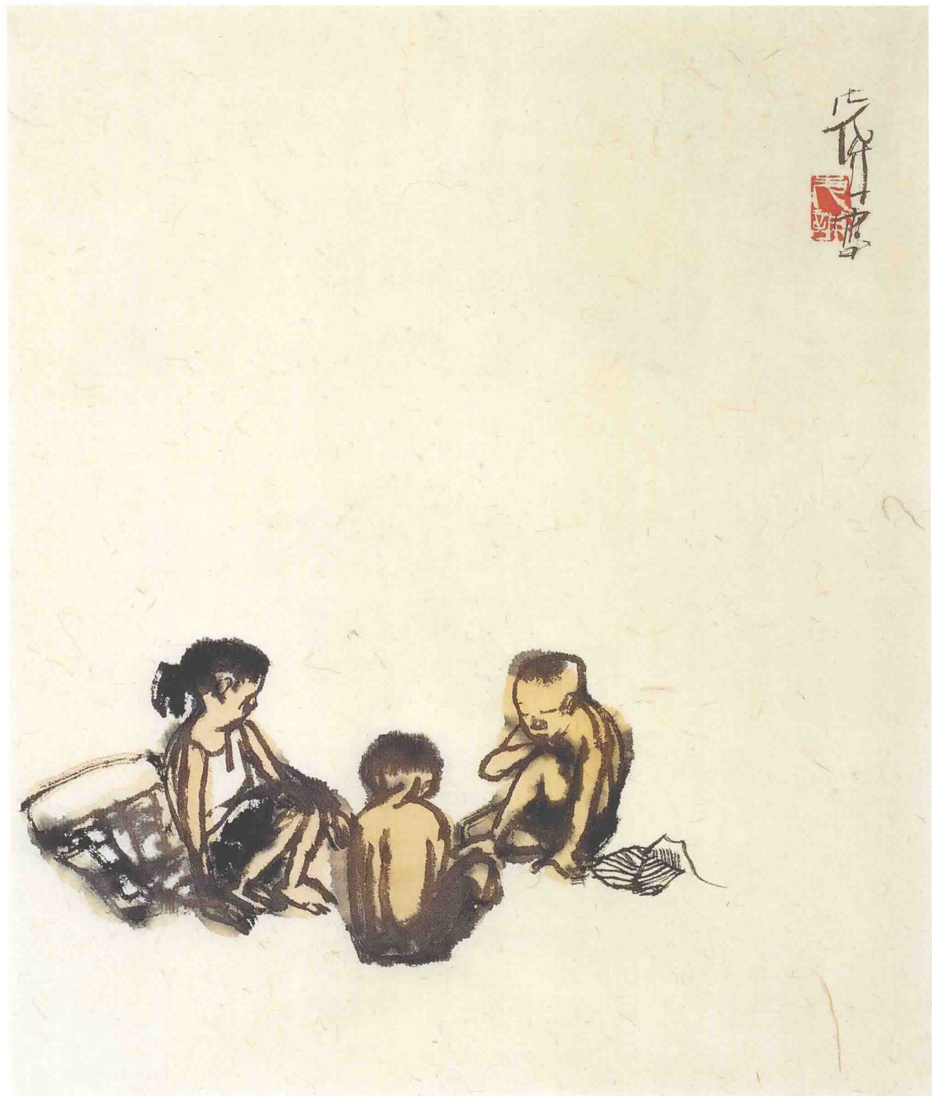
牧趣 34cm × 27.5cm 2004年