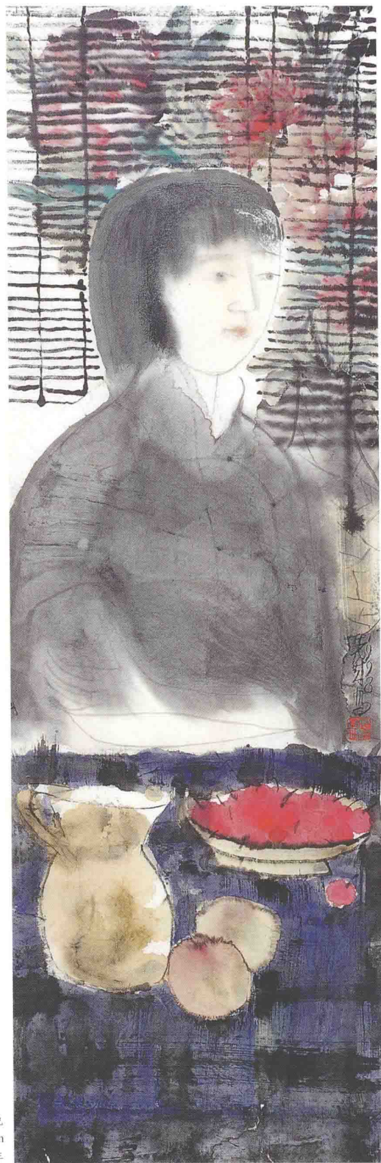
帘外春色 88.5cm × 27cm 1998年