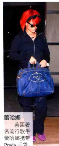
蕾哈娜 美国著名流行歌手蕾哈娜携带 Prada 手袋。