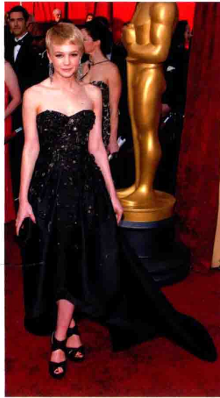
凯瑞·穆里根 身穿 Prada 礼服，出席奥斯卡颁奖礼红毯。