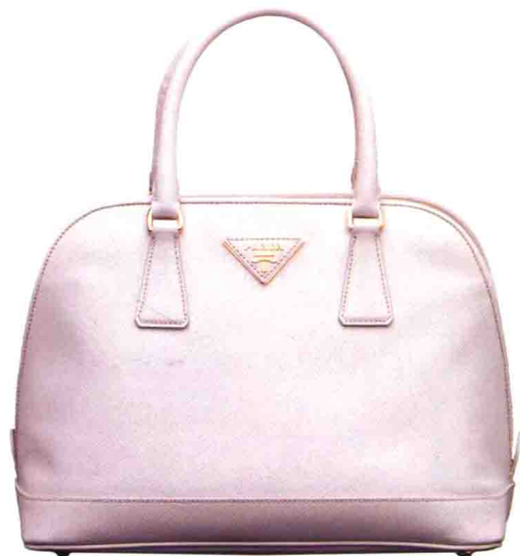
Saffiano粉白色皮革手挽袋