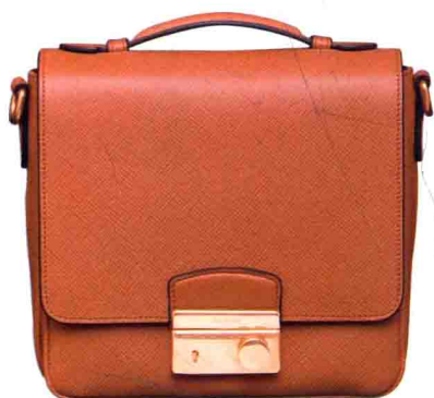
Saffiano焦糖色小牛皮迷你包