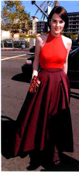
米歇尔·道克瑞 身穿 Prada 双色礼服裙，参加第 2013 届艾美奖颁奖典礼。