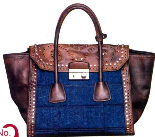
飞行蓝色丹宁肩背包