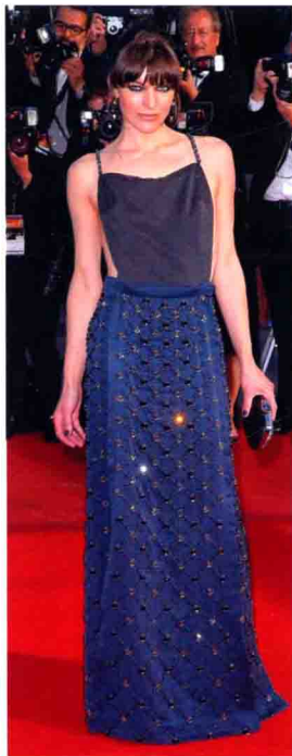
米拉·乔沃维奇 身穿 Prada 蓝色吊带连衣裙，出席法国戛纳电影节闭幕典礼。