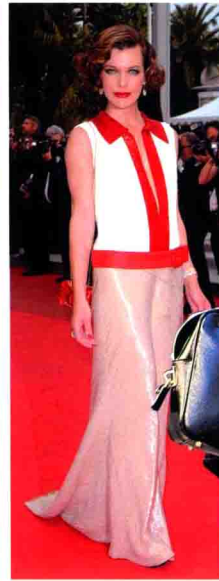
米拉·乔沃维奇 身穿 Prada 秋冬系列礼服亮相红毯。