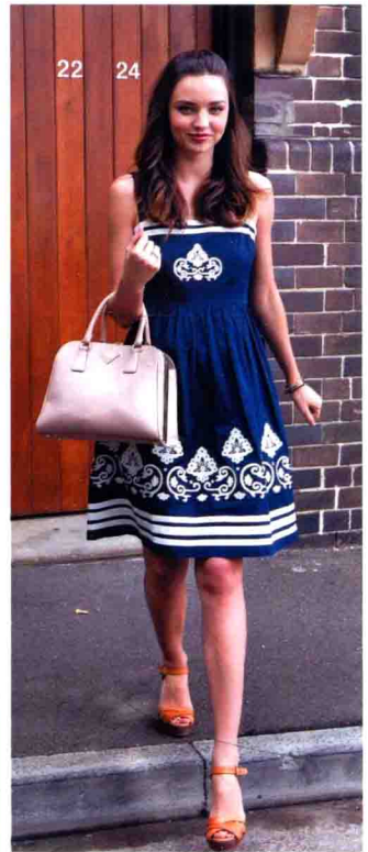
米兰达·可儿 携带 Prada 手袋上街，甜美出众。