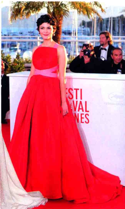
奥黛丽·塔图 身穿 Prada 桃红色缎面绑带晚礼服，出席第 66 届戛纳电影节。