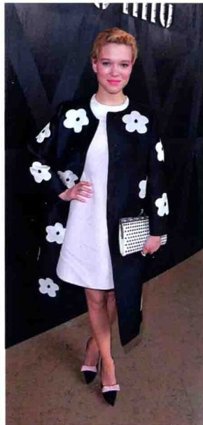
蕾雅·赛杜 身穿 Prada 粉色圆领连衣裙，配黑色印花外套，配粉色蝴蝶结高跟鞋和白色手包，出席副线品牌 Miu Miu 秀场。