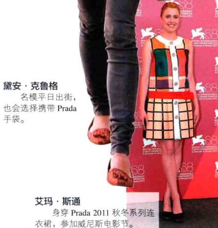
艾玛·斯通 身穿 Prada 2011 秋冬系列连衣裙，参加威尼斯电影节。