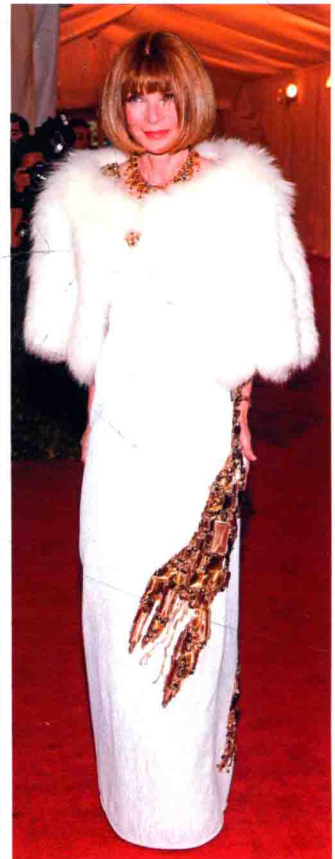
安娜·温图尔 凭借一身霸气无比的 Prada 定制龙虾礼服裙，成为纽约大都会艺术馆红毯上的大赢家。