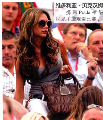
维多利亚·贝克汉姆 携带 Prada 褶皱尼龙手袋观看比赛。