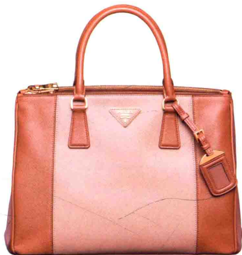
Saffiano榛子色拼貂皮啡色皮革托特包