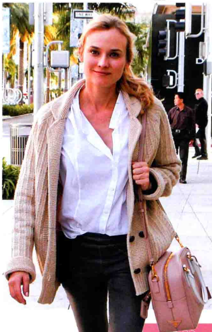
黛安·克鲁格 名模平日出街，也会选择携带 Prada 手袋。