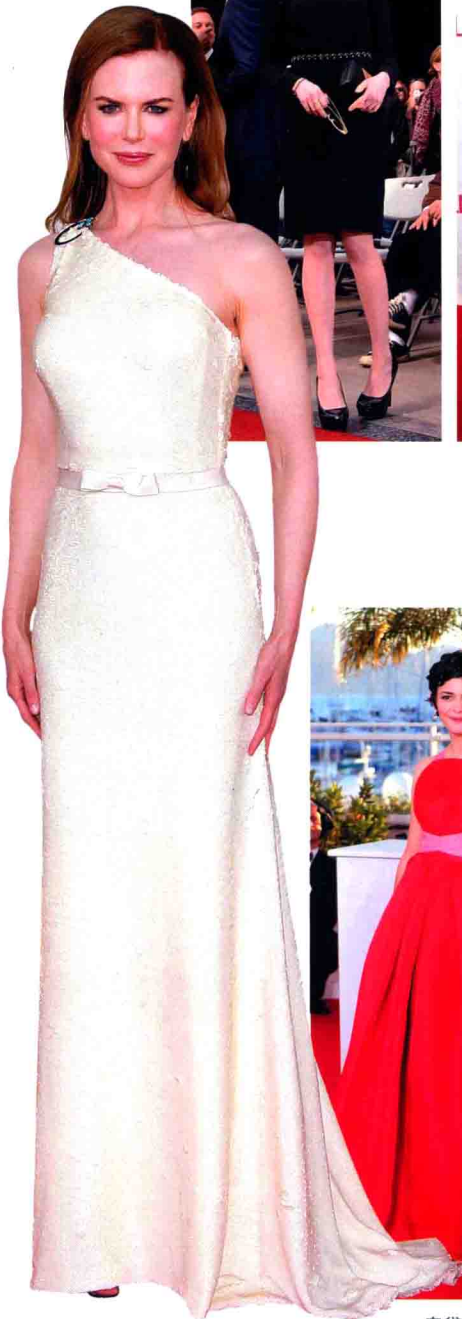
妮可·基德曼 身穿 Prada 粉白镶亮片斜肩晚礼服出席金球奖，惊艳全场。