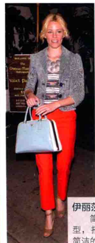
伊丽莎白·班克斯 简约的出街造型，搭配款式同样简洁的 Prada 手袋。