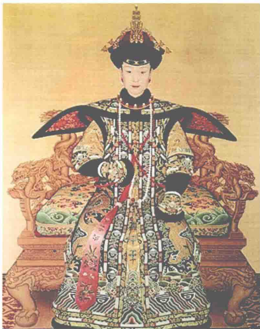
乾隆皇帝、皇后佩朝珠像