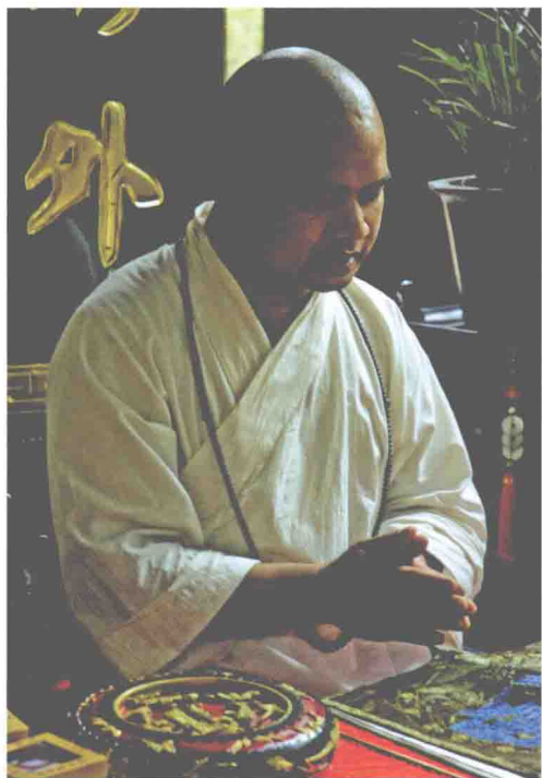
僧人脖子上佩戴着挂珠

上规格相同的众多珠子，以 18 颗、21 颗、108 颗最为常见。不同的子珠数具有不同的表征涵义。一串佛珠上的子珠大小基本相同，直径并无定数，小者不足 1 毫米，大者可达到几十毫米。隔珠，又称“节珠”、“数取”或“四天珠”，规格比子珠大，比母珠略小。隔珠把子珠平均分成若干等份，如 108 子的佛珠，安置 3 颗隔珠，每隔 27 子放置一颗隔珠，连同母珠，将念珠分成四等份。隔珠的材质一般与子珠有所不同。此外，一串完整的佛珠上包括记子和记子留。记子，也称“记捻”，俗称“计数器”，是串系在母珠另一端的两串珠子，用来计算掐念佛珠的数目。记子的规格比子珠更小，一般有 10 颗、20 颗或 40 颗，以 10 颗为一小串。记子留是记子末端的珠粒或饰物，形体比记子稍大一些，其主