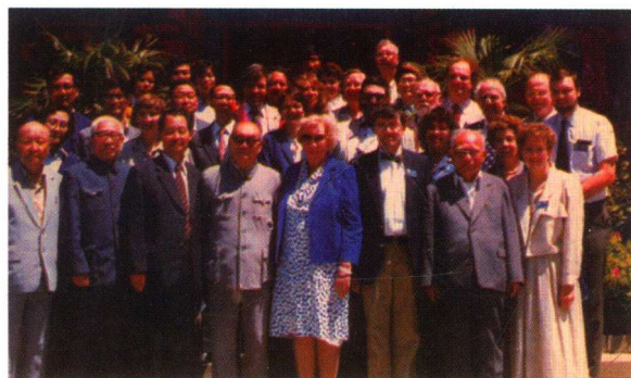
1988年，中华医学会中美医学交流会