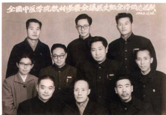
1963年，全国中医学院教材修审会议医史组全体同志留影