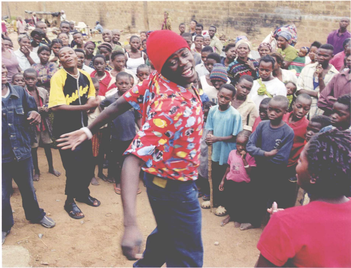
上图：一名志愿者正在非洲卢萨卡一个热闹的集市里表演短剧。这些短剧都是用来宣传 HIV 和艾滋病的危害及预防措施的。这张照片由吉迪恩·门德尔在 2003 年拍摄。