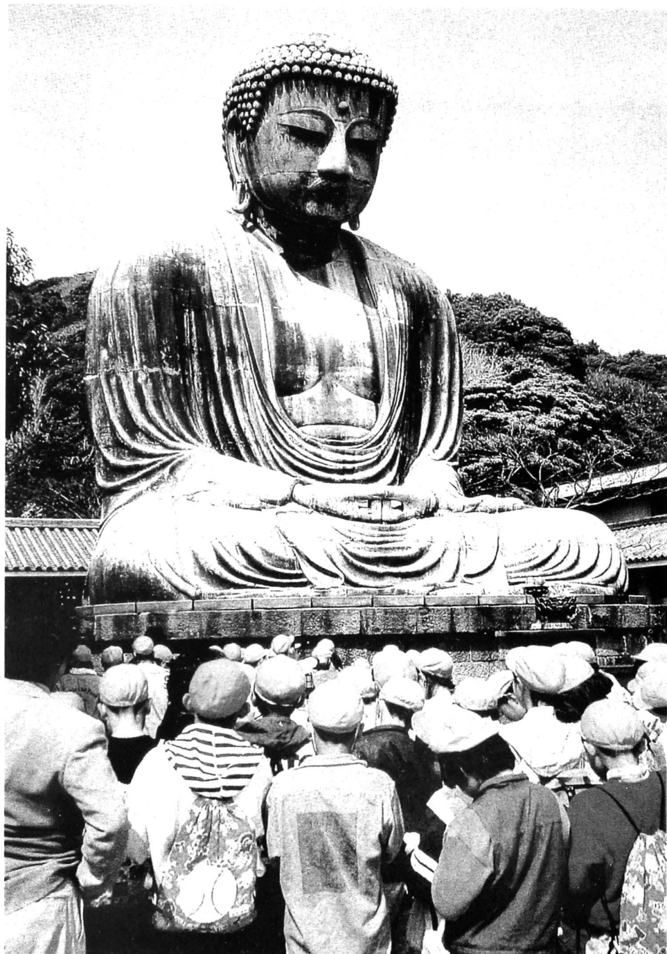
镰仓大佛 塑像 日本镰仓

镰仓位于日本关东靠近太平洋的海边，是历代佛教徒以及文学家、艺术家的云集蛰居之地，也是日本历史上镰仓时代的首府。大佛很高，但是空心的。佛身的背面有两扇门，人可以进入。镰仓大佛看起来厚重、实心、凝固，却腹中空空，仿佛一切都是假象。佛陀一生都很强调“空”的哲学，因此当他被当做偶像崇拜时，也被称为“空王”。