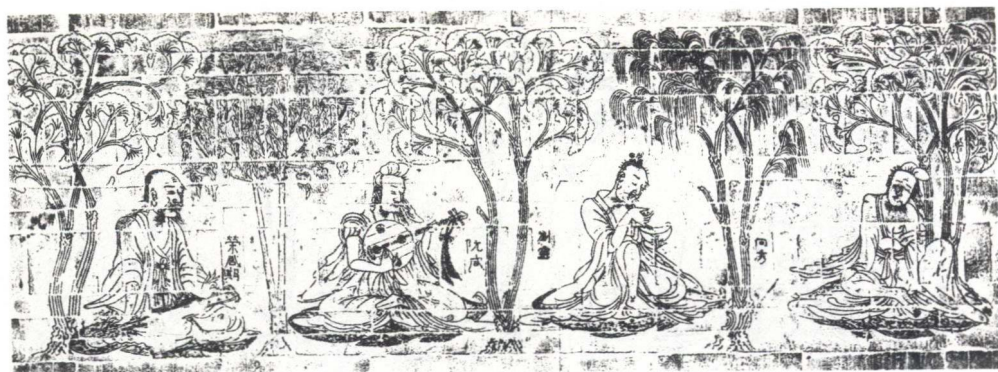
南朝宋《竹林七贤与荣启期画像砖》（北壁拓本）80×240厘米 南京博物院藏 左起分别为：荣启期、阮咸、刘灵、向秀