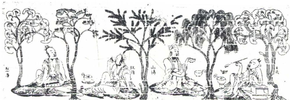
南朝宋《竹林七贤与荣启期画像砖》（南壁拓本）80×240厘米 南京博物院藏 左起分别为：嵇康、阮籍、山涛及王戎