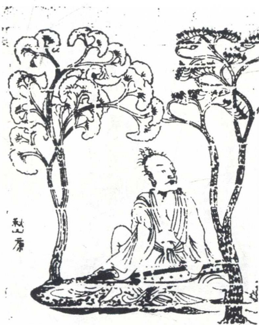
南朝宋《竹林七贤与荣启期画像砖》（嵇康）