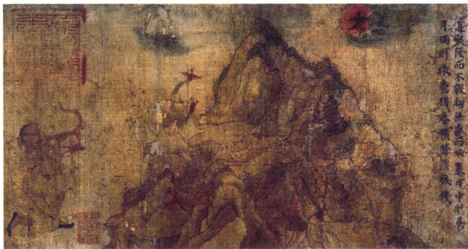
东晋 顾恺之《女史箴图》局部 绢本设色 全图尺寸24.8×348.2厘米 英国大不列颠博物馆藏

“春蚕吐丝”式线条格调高古，有其优点，但勾勒山石、树木及所有人物、动物都用这一种线条就有缺憾。