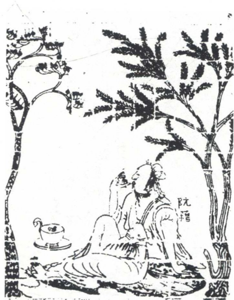
南朝宋《竹林七贤与荣启期画像砖》（阮籍）