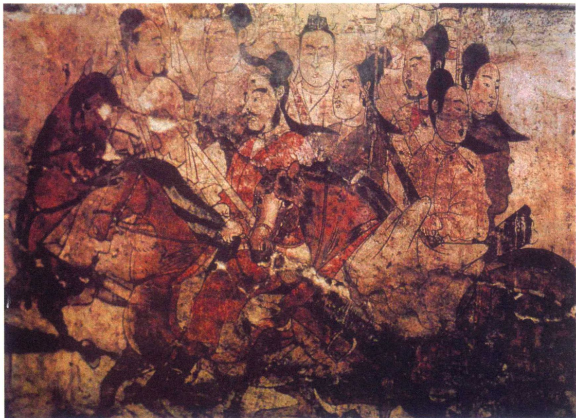
北齐 《鞍马出行图》（局部）壁画 1979年山西省太原市王郭村娄睿墓出土 山西省考古研究所藏