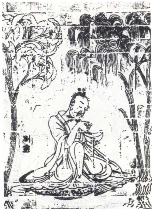
南朝宋《竹林七贤与荣启期画像砖》（刘灵）