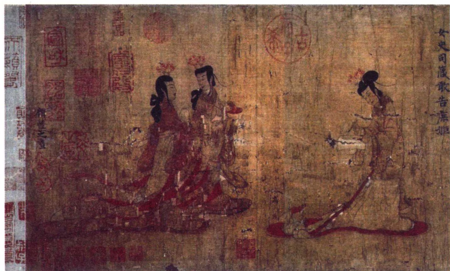
东晋 顾恺之《女史箴图》局部