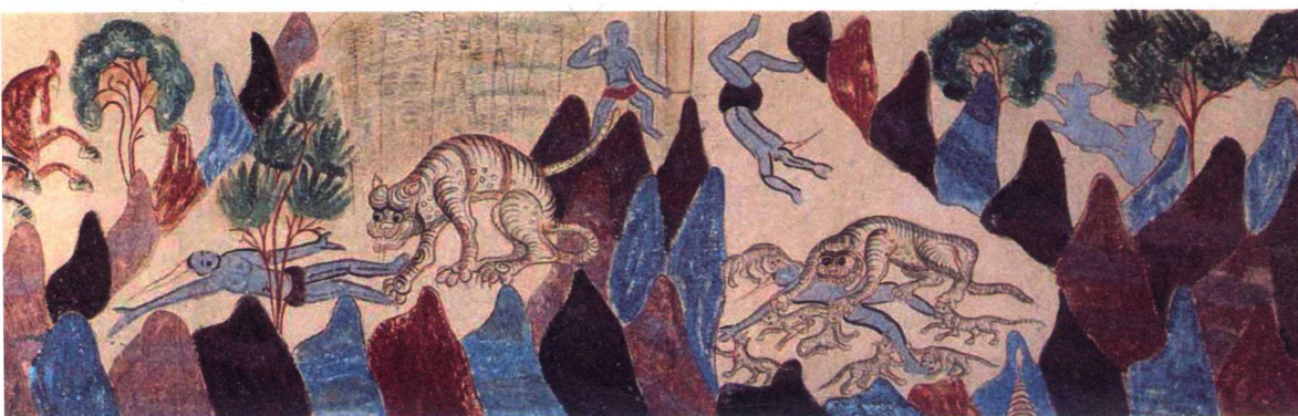
北周《萨埵太子本生故事》敦煌莫高窟第428窟主室东壁门南 早期山水画之状况，如张彦远所云：“群峰之势，若钿饰犀栉。或水不容泛，或人大于山，率皆附以树石，映带其地。列植之状，则若伸臂布指。”