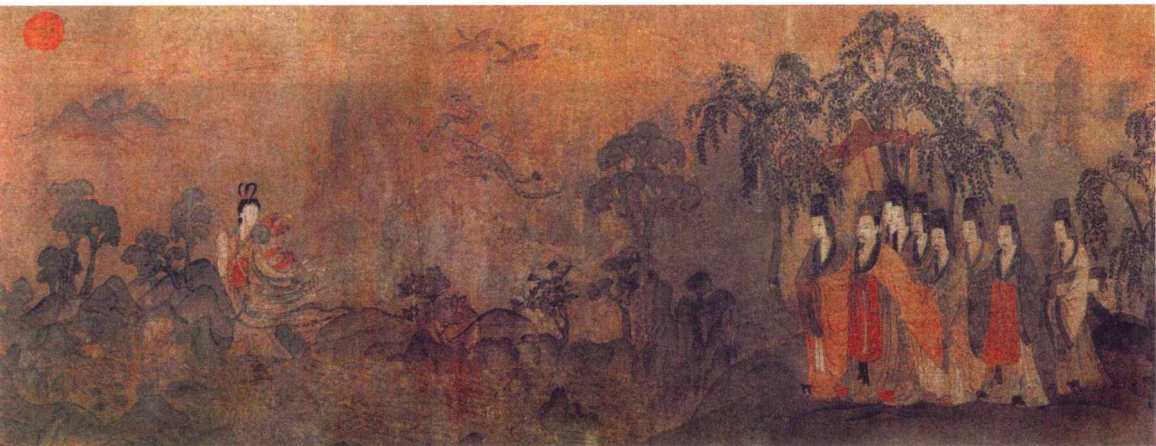
(传)东晋 顾恺之《洛神赋图卷》(宋摹本)局部 绢本设色 全图尺寸27.1×572.8厘米 北京故宫博物院藏

《洛神赋图》被说为顾作，在元代之前的任何著录中都不载，在顾诞生后一千多年中，没有任何根据说顾作过此图，所谓据说，实则根本无据。目前我们所见的《洛》图，最早见于清代《石渠宝笈初编》，距顾已一千四百余年，《石渠》作者是根据图上所谓赵孟頫、李衍、虞集等人的题跋和印章而定。但这一切经鉴定：“均伪。”《洛神赋图》虽不是顾作，但作为晋画看待还是有一定价值。