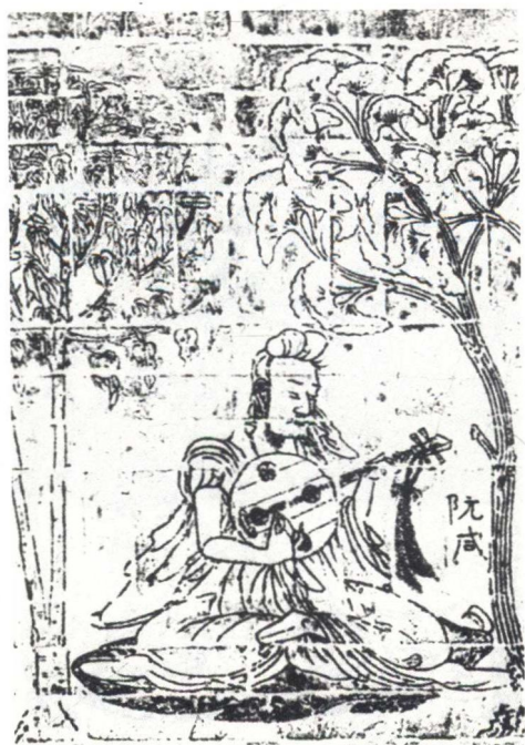
南朝宋《竹林七贤与荣启期画像砖》（阮咸）