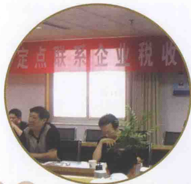
●积极创新稽查方式方法,不断优化稽查服务,召开专题会议,辅导企业查前自查