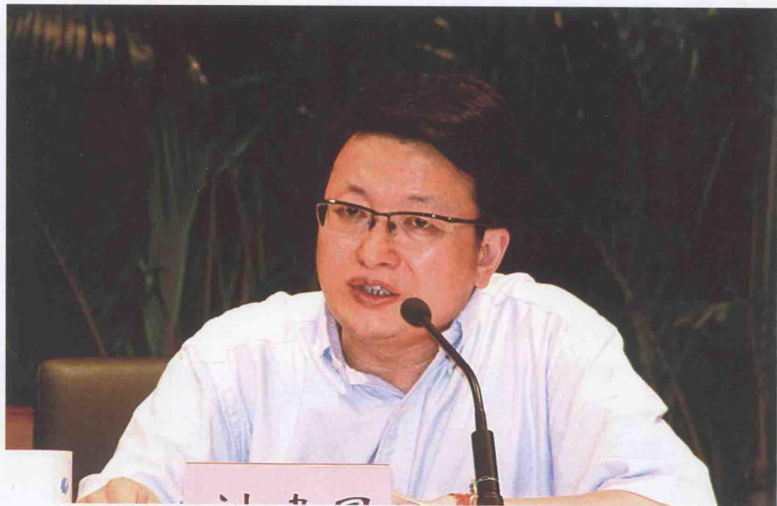
国家税务总局稽查局副局长刘建国布置案件检查工作。