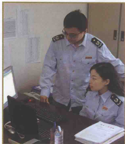
天津市国税稽查局在税收征管系统查询纳税人信息