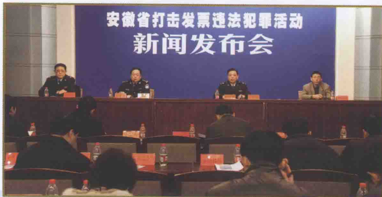
● 打击发票违法犯罪活动新闻发布会 ●

管理；夯实基础工作，加强调查研究，强化督察和考核；推进信息化稽查，推广稽查查账软件，积极研发稽查 workflow 管理平台；狠抓干部业务培训和作风建设，选拔了一批总局、省局和市局稽查人才库后备人选，提升了干部队伍的政治素质和业务水平，储备了一支能攻难关、善打硬仗的稽查人才队伍。