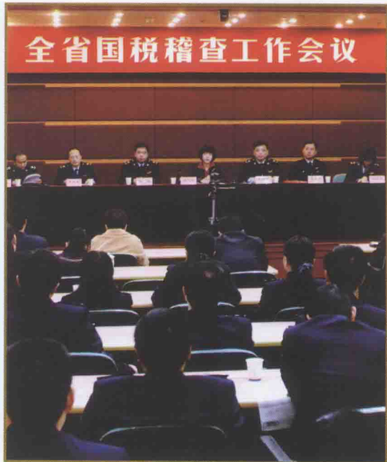
● 安徽省国税稽查工作会议 ●

2009年，该局以推进集约稽查为重点，省、市联动稽查为突破，全面推行分级分类稽查，进一步整合了稽查资源，加大了执法力度，提升了工作质量和效率，全年实现查补收入14.81亿元，同比翻了一番，占全省国税收入总量738亿元的2%以上，在2010年全国税务稽查工作会议上，该局重点税源检查、税收专项检查、打击发票违法犯罪三项重点工作受到总局通报表扬。在充分履行职能作用的同时，该局不断完善制度机制，推进科学化、规范化