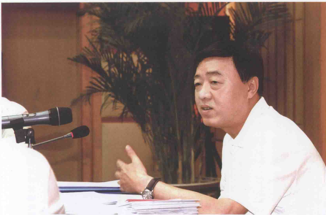
国家税务总局副局长解学智调研指导税务稽查工作。