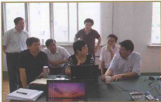
2010年8月19日，总局稽查局领导在辽宁调研审计型检查工作。与检查人员交流审计型检查工作情况。

2007年，辽宁省国税局党组作出创新分类检查机制，构建现代税务稽查的重大决策。经过2007年积极探索，2008年示范运行，2009年全面推行，围绕税务专项检查、重点税源企业检查、重大税收违法案件查处等三项主要任务，分别采取常规型检查、审计型检查、打击型检查三类检查方式。其中：审计型检查是借鉴现代审计技术，以涉税风险为导向，以专用工作底稿为载体，以信息技术为依托，通过实施风险评估、控制测试、实质性程序和纳税遵从评价四个阶段，对纳税人的经济活动、财务会计记录和纳税情况进行系统审核、分析、取证，确认涉税问题并做出纳税遵从评价的税务检查。实践证明：审计型检查是驾驭重点税源企业检查的有效方法，可以有效防范重大税收流失。三年来，省局共组织了41户省级重点税源企业检查，共查补税款近7亿元，户均查补近1700万元。