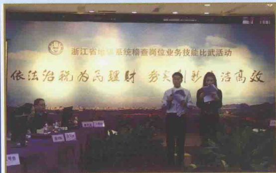
2010年浙江省地税系统稽查岗位业务技能比武活动

坚持依法治税，大力整顿规范税收秩序。 “十一五”期间，全省地税稽查部门共检查纳税户8.6万余户，查补收入96.7亿元，查处大要案1055件，移送司法机关457件，曝光606件，依法严肃查处了一批重大涉税违法案件，有力震慑了涉税违法犯罪分子，维护了地方税收秩序，为企业健康发展营造了法治、公平、健康、有序的税收环境。