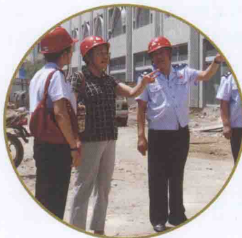
对建筑企业实地核查

犯罪行为，查处各类发票违法案件179起，抓获犯罪嫌疑人47人，查处各类违法发票11万份、金额1.87亿元，严厉打击了涉票违法行为。