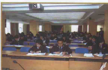
北京市国税局稽查局以新的税务稽查工作规程为抓手，着手抓规范管理和队伍建设。图为2010年3月6日新规程稽查全体干部考试现场