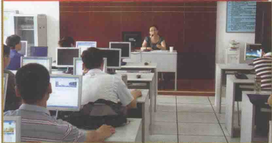
河北省国税稽查局信息化管理企业税务稽查培训