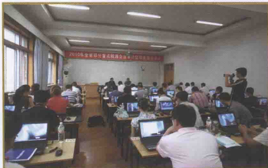
2010年辽宁省国税稽查局统一组织开展全省部分重点税源企业审计型检查工作查前培训工作会议。