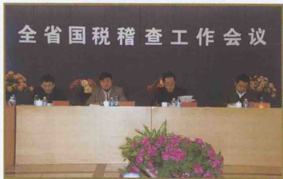
黑龙江省国税稽查工作会议

量化考核、加强督导，保障措施促成效。 从考核上，将稽查收入完成情况纳入硬性考核指标，实行稽查任务与绩效考核、办案经费分配等紧密挂钩，并实行按月通报制度，将稽查“四率”等考核指标在全省进行通报和排名；从督导上，组成了由省局稽查局局长带队的工作调研组对各地工作的开展情况进行不定期调研督导，确保稽查工作的整体推进。