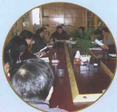
●通过各种形式,定期组织业务学习和政治理论学习,提高稽查人员整体素质,适应新形势下稽查工作需要