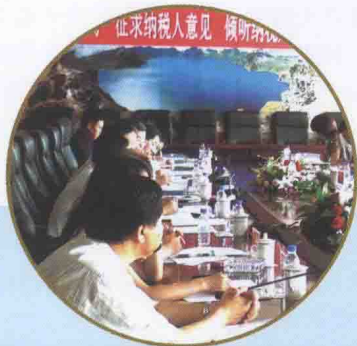
举办纳税人座谈会