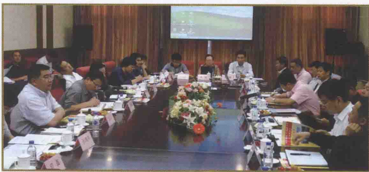
公安部和国家税务总局在长春召开CPU骗税工作会议

质得到了进一步提升。以预防腐败体系为重点,完善内控机制,排查稽查执法风险,实施“一岗双责”、“一案双查”,邀请省检察院和省局主管监察工作领导对干部进行廉政教育,提高了稽查干部廉政意识。采取多种形式,有针对性地开展各类税收业务培训,效果比较明显。通过组织稽查全员考试,开展稽查业务知识竞赛等活动,进一步提高了干部的业务能力。在年初总局组织的稽查人员业务考试中,全省996名干部参加了考试,平均成绩121分,及格率98%。