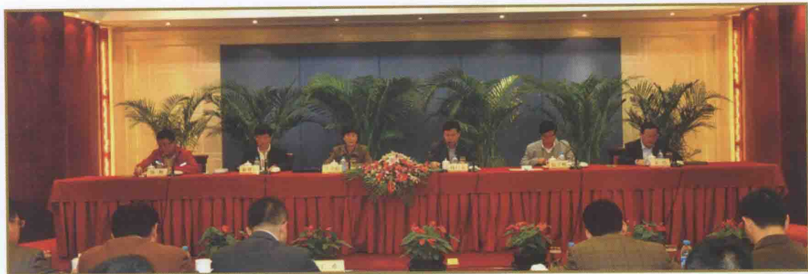
2010年浙江省地税稽查工作会议