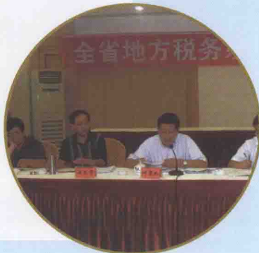
●加强对系统的督察督导,年中召开稽查工作汇报会,全面推动稽查工作的深入开展,确保各项工作目标的完成