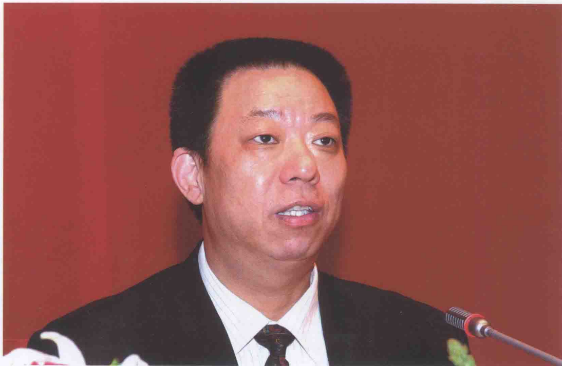
国家税务总局稽查局副局长李亚民主持税务稽查工作经验交流会。