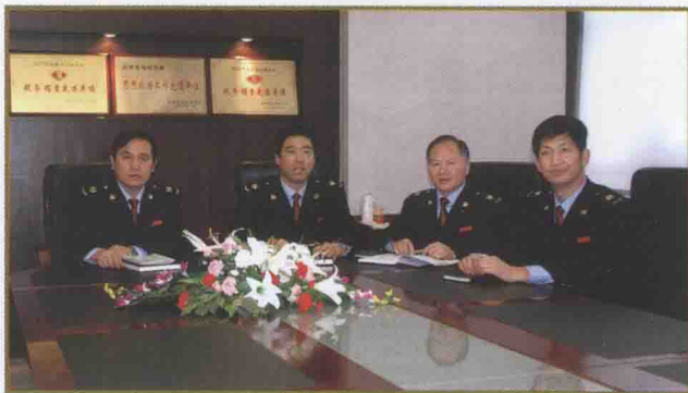
团结奋进的吉林省地税稽查局领导班子

合稽查资源，积极探索实践“市州大稽查”模式，增强了稽查执法刚性，提高了办案质量。推广应用稽查管理软件和查账软件，强化了稽查办案科技手段。