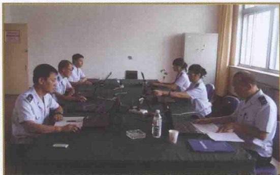
2010年辽宁省国税稽查局组织的第一审计型检查工作组利用现代化手段在开展工作的场景。