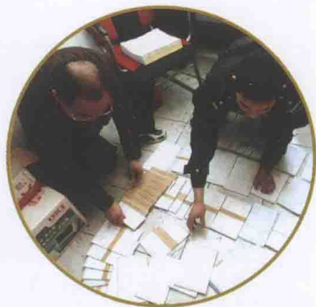
稽查人员与公安人员联合查处发票制假窝点

强化培训，优选33名稽查业务骨干，结合药品经销行业专项检查选择15户不同类型企业，采取“以查代练、以查代训”的培训方式，为全省国税稽查培养了一支信息化稽查技术团队。组织房地产、医药、电力、金融保险等多个行业税收专项检查查前培训，开展电力生产企业查前摸底调研，在税收专项中组织一线检查人员汇报交流检查经验，快速提升全省稽查人员的业务技能，一支业务精湛、纪律严明，拉得出、打得赢的稽查队伍初步建立。