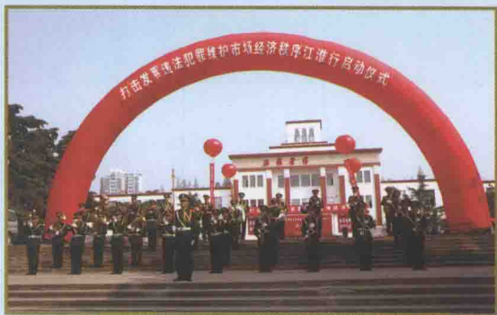
●联合有关部门及中央驻皖、省内十多家新闻媒体,开展“打击发票违法犯罪、维护市场经济秩序”江淮行大型宣传活动,分南北两片,赴全省发票违法犯罪活动重点地区采访

查”,全面开展查前自查,全年共组织7704户企业自查,自查收入6.71亿元,占全年稽查收入的60.72%。以建设现代化分局为抓手,积极加强稽查队伍建设,强化宣传调研,推进以查促管,优化稽查服务,深化信息化应用,稽查方式方法不断创新,稽查效率和质量进一步提升。