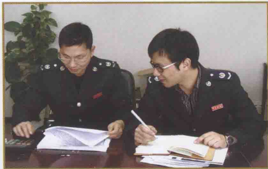
检查人员在进行税务检查