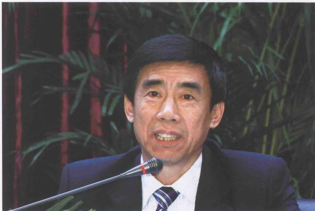
国家税务总局稽查局局长马毅民部署税务稽查工作。