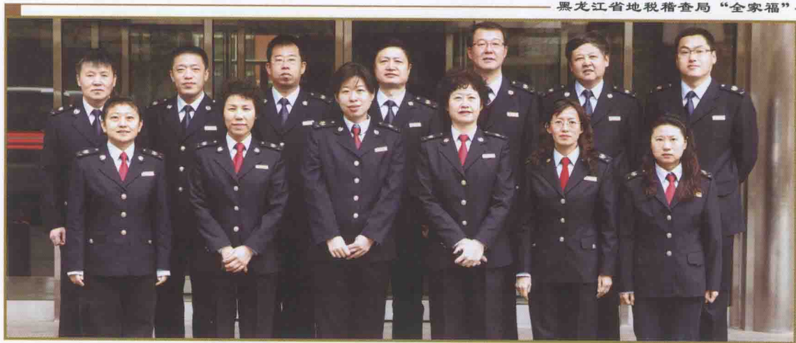
黑龙江省地税稽查局“全家福”

【队伍建设】 为进一步提高稽查人员素质，培养高层次稽查人才，对全省稽查人员开展分层次培训。通过视频培训形式对全省1200多名稽查干部进行了全员、全封闭培训，聘请扬州税务学院专家教授系统讲授新会计准则和新企业所得税法的相关知识，学员与教师利用手机短信提问答疑互动，收到了良好效果。