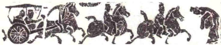
图1.4 迎宾画像，东汉后期，苍山县博物馆藏