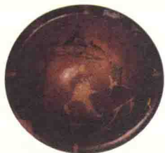
图16 彩陶人面鱼纹盆，仰韶文化半坡类型

物质文明的发展需要精神文明的引领。人类在追求物质生活的同时，从来就是伴有精神追求的。新石器时代，人类生存条件非常恶劣，即便如此，他们还会在陶罐上面画画，用海蚶壳、石片做成佩饰；他们还会思考地球以外的事物，许多神话就是这一时期的产品，这就是精神追求啊！