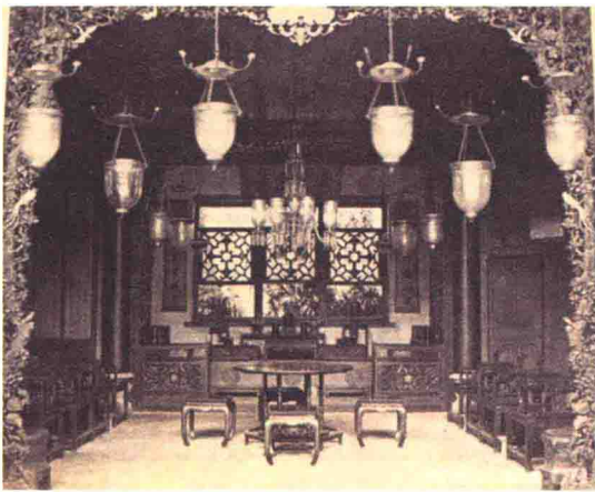
图17 清代的会客厅

礼作为中国传统文化的核心，完全可以为社会主义精神文明建设和再塑中华民族的形象服务，它的作用千万不能低估。