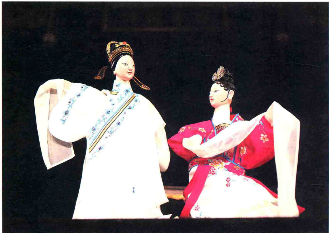
南派布袋戏细腻委婉的生旦戏

《台湾通志·风俗志》载：“掌中班，削木为人，以手演之，事多稗史，与说书同。”其中亦记载关于布袋戏传说：“此戏发明于泉，约三百年前（明嘉靖年间），有梁炳麟者，屡试不第，一日偕友至九鲤仙公庙卜梦，仙公执其手，题曰：功名在掌上。梦醒，以为是科必中，欣然而归，偶见邻人操纵傀儡，略有所感，自雕木偶，以手代丝弄之，更见灵活，乃借稗史野乘，编造戏文，演于里中。”闽南民间亦传：梁炳麟为明嘉靖间人，赴试落第，愤然而归，流落街头说书，然碍于面子，不愿抛