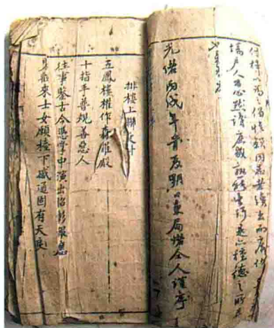
南派布袋戏清光绪十二年的戏文影印本