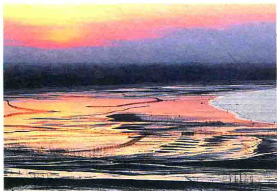
深沪湾海底古森林遗址