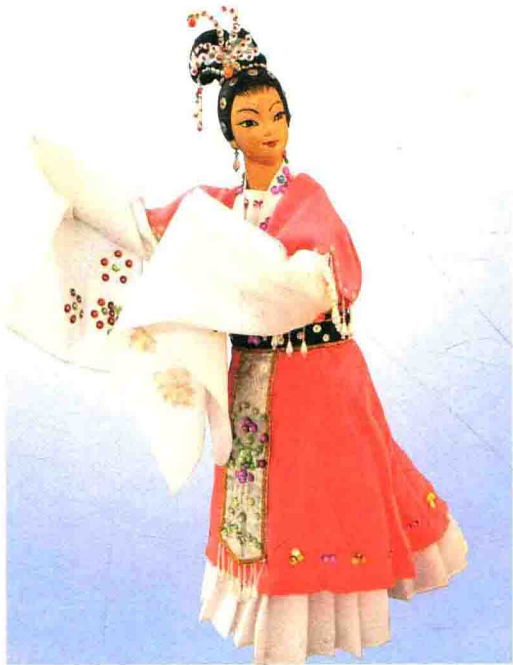
南派布袋戏精致的旦角造型

南派布袋戏，指繁衍、兴盛于泉州晋江地区并广泛流传于闽南一带的掌中木偶戏，相传兴于明代嘉靖年间，源自“讲古”（说书）的说唱形式，后以指掌操控布袋木偶表演讲述故事，以道白为重，传统剧目类型丰富，部分戏文自傀儡戏和梨园戏出，依泉南方言，唱南曲、傀儡调。掌中木偶表演迅捷灵敏，模形仿意，人偶合一，声出形到，文武兼擅，自由活泼，随心所欲，大开大合，神采奕奕。而文戏尤佳，典雅俚俗兼容，庄重谐趣并包，细腻委婉处亦有梨园戏之古雅做派。南派布袋戏历史悠久，在闽南诸多戏曲剧种格局乃至全国的戏曲门类中，特点鲜明、韵味独特、雅俗共赏的南派布袋戏是极为珍贵的偶戏剧