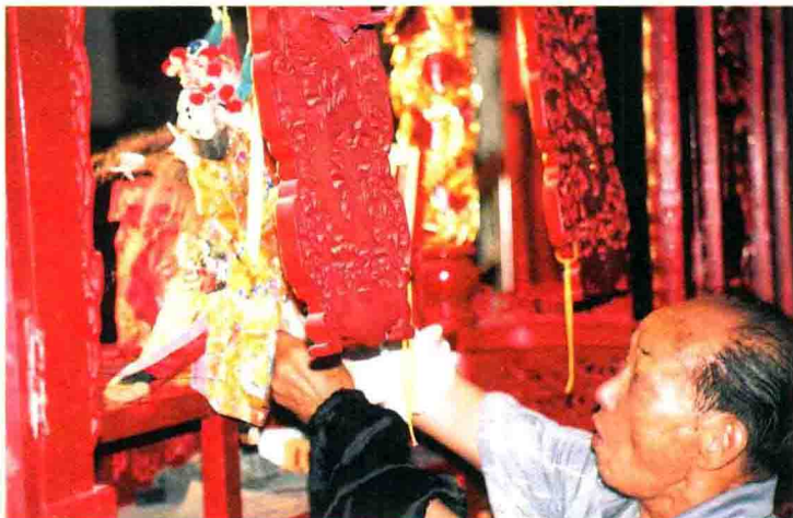
南派布袋戏传统表演方式