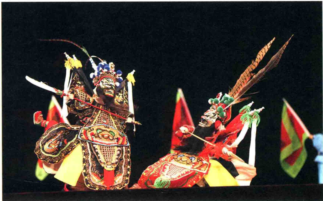
南派布袋戏的古朴雄浑

头露面，便以“隔帘表古”形式说书，在布袋小舞台上挂帘遮挡，并隐身其后说书。某日，一提线木偶艺人于帘外闻之，劝之手托偶人，兼说并做表演故事，自此闽南便有了以手掌操作的偶人戏。因其语言生动，故事精彩，掌中偶人表演形象传神，至此声名远扬，在民间被誉为“戏状元”。