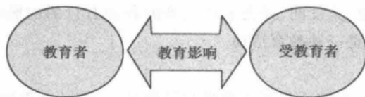
图 1-1 教育三要素