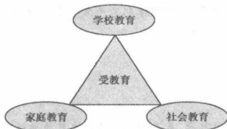
图 1-2 三种主要教育形态间的关系