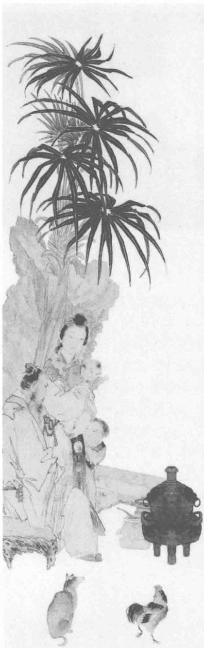
欲治其国者，先齐其家。

物格而后知至，知至而后意诚，意诚而后心正，心正而后身修，身修而后家齐，家齐而后国治，国治而后天下平。