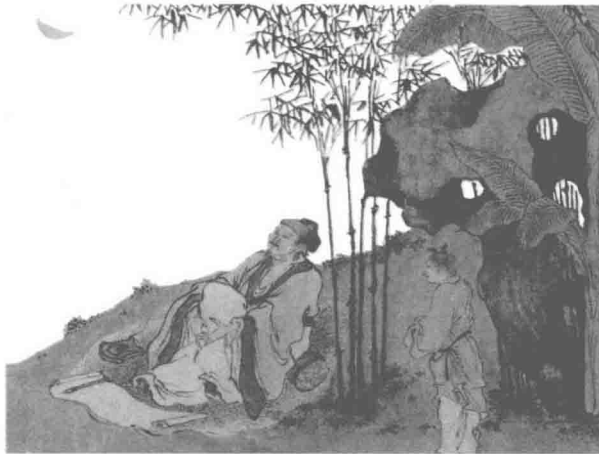
▲ 南生鲁四乐图 明 陈洪绶

一般来说，我们把格物、致知、诚意、正心作为道德的内在修为，而把修身、齐家、治国、平天下作为道德的外在修为。《大学》提出的“修身”途径主要是指“八条目”中的格物、致知、诚意、正心，实际上可以概括为两个步骤：正心诚意和格物致知。《大学》认为，修身的起点是格物致知，《大学》对格物致知没有做过多的解释，通过历代一些学者的注疏，我们可以看出，所谓“格物”就是指“对自然外界进行研究”的意思，“格物”、“致知”是联系紧密、层层递进的两个步骤，“格