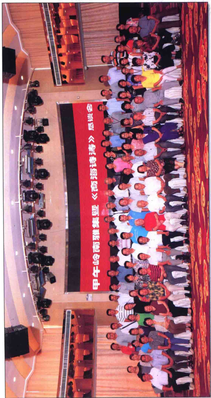
2014年7月，出席甲午岭南雅集暨《商海诗涛》座谈会的中华诗词学会领导、全国著名诗人代表与广西诗词界代表合影