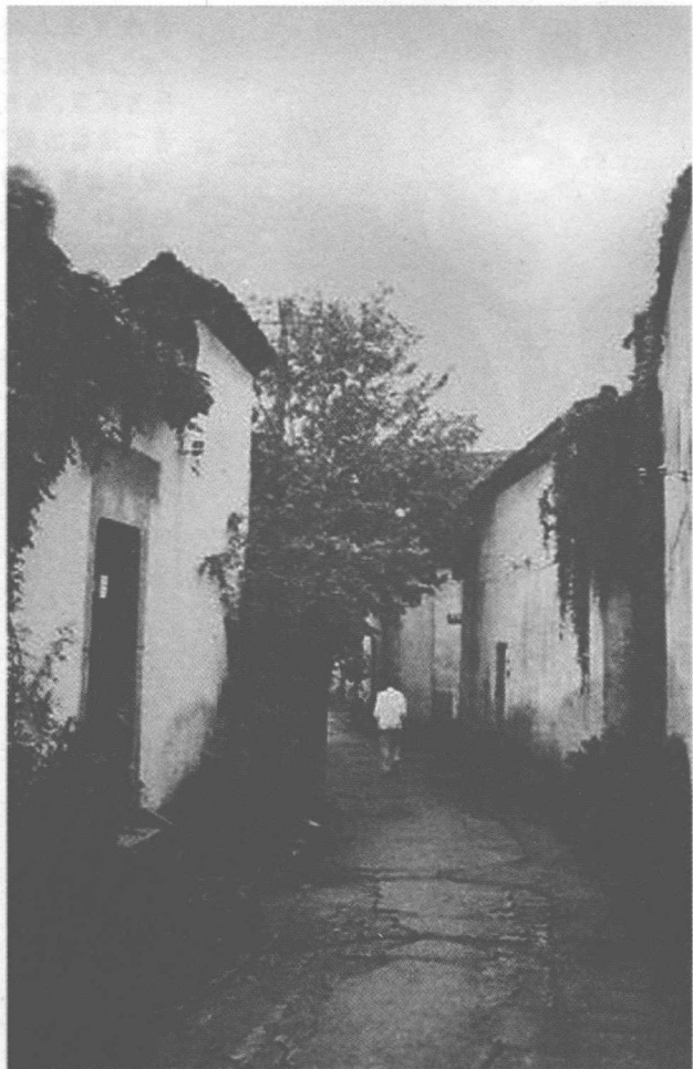
杭州蔡官巷。林徽因出生在距此不远的陆官巷,5岁时随祖父母移居蔡官巷,8岁时随祖父由杭州迁居上海。