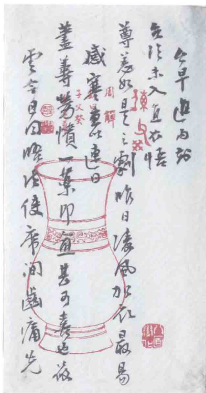
张荫桓致孙毓汶函之一