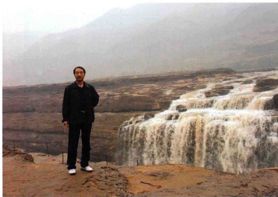
作者在壺口瀑布留影