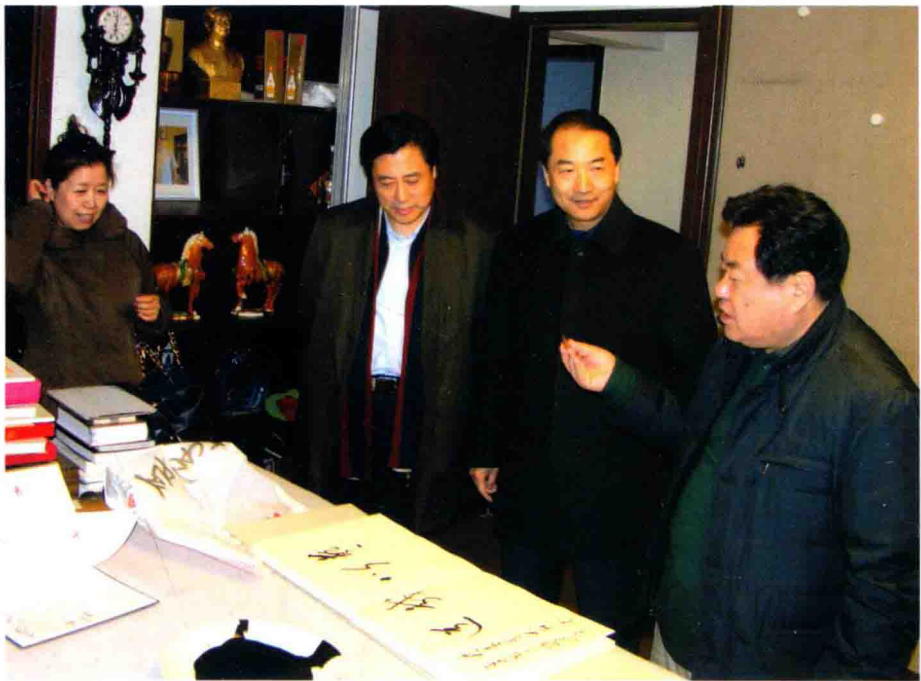
作者与文化部副部长董伟和中国音乐家协会党组书记、常务副主席徐沛东及夫人在书画室