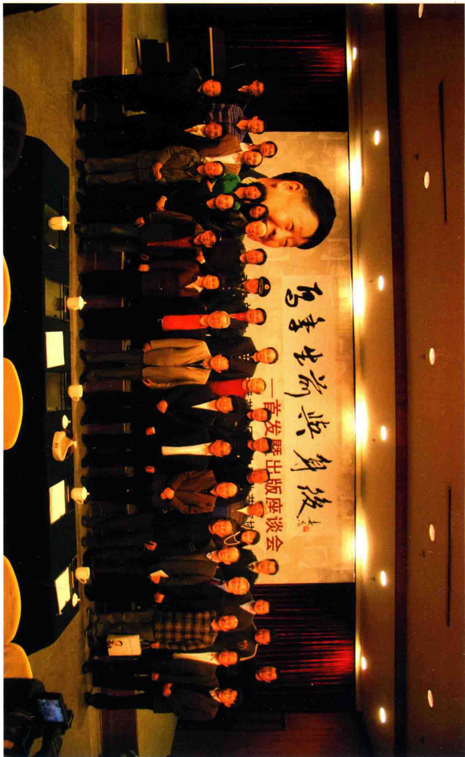
《马季生前与身后》首发式合影