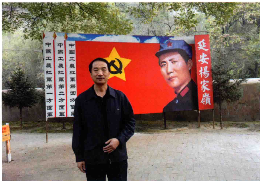
作者参观革命圣地延安