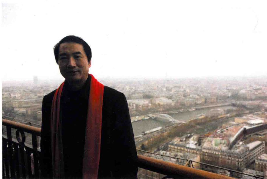
作者在巴黎市中心俯瞰塞纳河