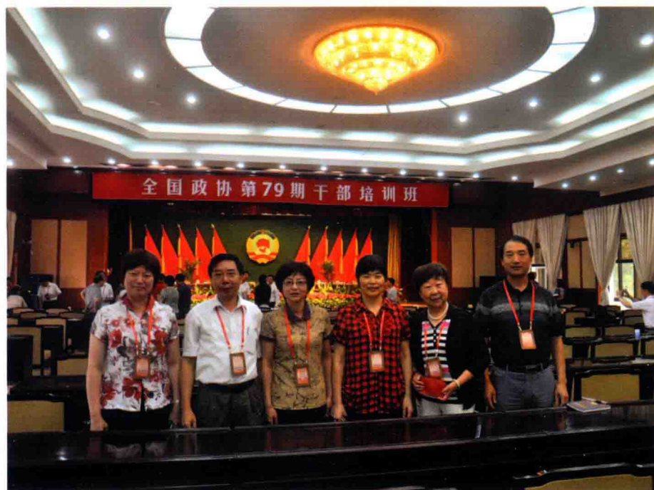
2011年6月参加全国政协北戴河培训班