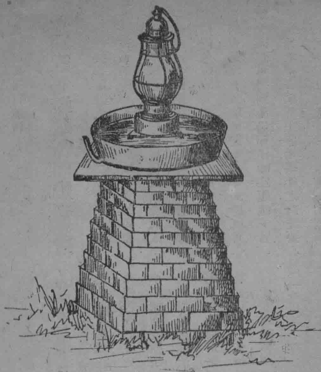
燈測預的座燈堆所石磚於置安(一圖)