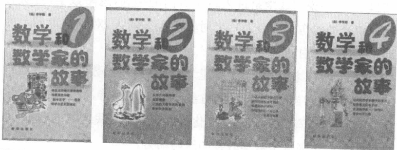
新华出版社的《数学和数学家的故事》

此书在香港、台湾及内地得到许多人的喜爱。新华出版社在1995年把第一册到第七册汇集成四册，发行简体字版。