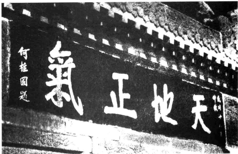
1939年秋何柱国将军于陕西神木为浩然亭题书亭额