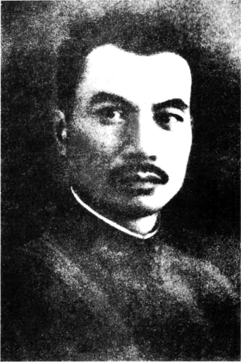
何柱国将军（1934年12月摄）