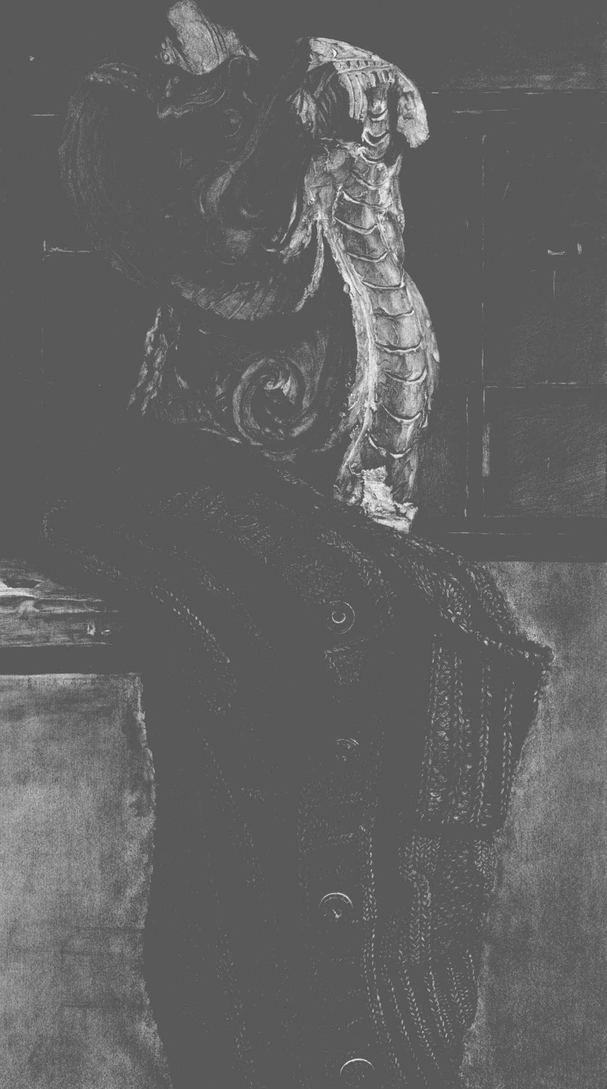
图 1-4 带毛衣的静物 / 李青