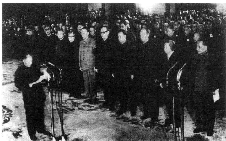
一九八一年四月十一日茅盾追悼会在北京举行,由邓小平主持,胡耀邦致悼词