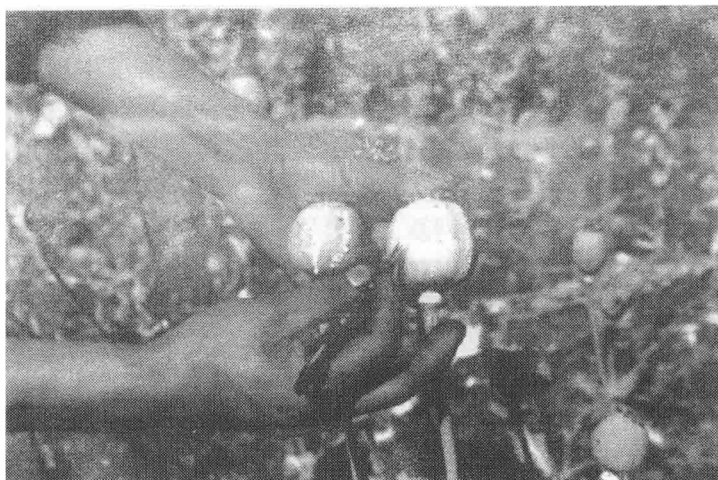
图2 在翠绿的罂粟果上割取鸦片

罂粟花期过后，枝头卸去霓裳般的花瓣，结出小灯笼似的椭圆蒴果，如果在未成熟蒴果身上划上几道伤痕（见图2），次日清晨便渗出白色的浆汁，把这浆汁阴干，就成为棕